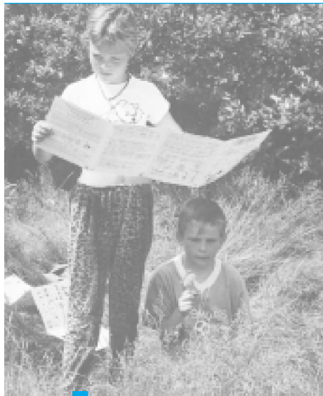
HE Zoekkaarten zijn een belangrijk onderdeel in de rijke buit aan lesmaterialen