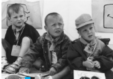
HE Jong zeegeweld

Onze kust is meer dan zon en strand tijdens de vakantie maanden. Zee, strand, duin en polder vormen een boeiend geheel vol natuur en cultuur. En daar willen talrijke partners de nodige aandacht aan schenken. Je vindt vast wel meerdere initiatieven waarop we je straks misschien mogen verwelkomen. Veel bezoekerscentra, werkingen en initiatieven zijn in het verleden ontstaan in de schoot van vrijwilligersorganisaties. De bezoekerscentra het Zwin (Knokke-Heist) en het Marien Ecologisch Centrum (Oostende) zijn zowat de pioniers aan onze kust. Ze stellen sinds jaar en dag de zee en haar omgeving centraal. Daarnaast staat het Centrum voor Natuur- en milieueducatie (CVN) ondermeer in voor de vorming van natuurgidsen. Deze enthousiaste groep van mensen spoort de kustgasten aan om de natuur te beleven. De zee inspireerde ook de educatieve werking van de vzw. Horizon Educatief of bracht jongeren bij de Jeugdbond voor Natuurstudie en Milieubescherming