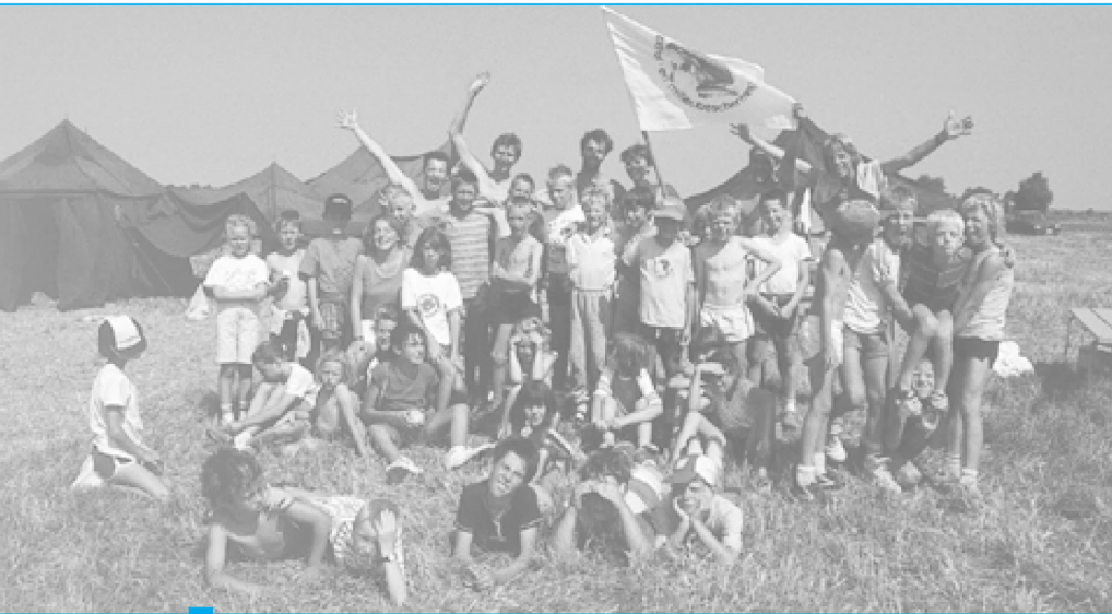
VL De Jeugdbond voor Natuurstudie en Milieubescherming (JNM): een organisatie met pit, die bijdraagt aan een betere kennis en bescherming van het milieu

Waar land en zee elkaar ontmoeten, ontstaat een fascinerend spel van eb en vloed met speelmogelijkheden voor strand, duin en polder. Kinderen, jongeren en volwassenen worden er uitgedaagd om de kustbiotopen op een actieve wijze te ontdekken. Duurzaam omspringen met het kustmilieu is er de heersende uitdaging. Om dit alles waar te maken ontpopte zich in de kuststreek een schat aan natuur- en milieueducatieve initiatieven die we graag even kort aan u voorstellen: