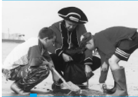
HE Veldwerk aan zee staat voor experimenteren, onderzoeken, gissen en missen, meten en vergelijken, graven en zeven...

Het is één van de vele praktijkvoorbeelden die aantonen dat wanneer partners samenwerken er veel mogelijk wordt! Stilaan groeien verspreid over de kust een aantal voorzieningen en centra waar de bevolking in het algemeen en het onderwijs in het bijzonder terecht kunnen voor ondersteuning en projectmatige samenwerking. Voor de verschillende bezoekerscentra ligt een belangrijke taakstelling weggelegd om samen met het steunpunt Natuur- en milieueducatie Middenkust verder te behartigen.