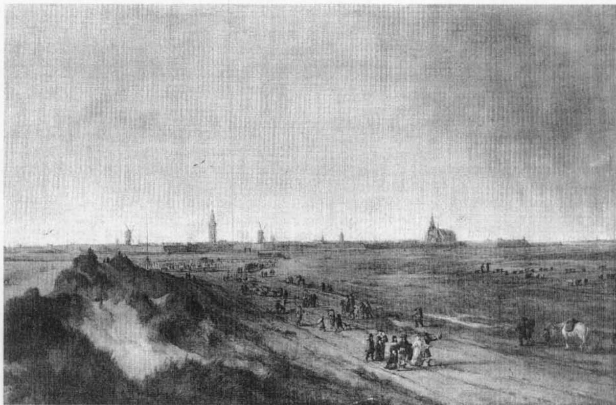
Bij het bekijken van het stadsbeeld zien we aan de rechterzijde een kerk. Dit is de Sint

De kunstschilder Robert Van Hoecke (1622-1665) schilderde toen zijn "Gezicht op Oostende". Het is een schilderij op eikenhout 58 op 93 cm. groot. Het berustte in de verzameling van aartshertog Leopold Wilhelm vóór het opgenomen werd in de "Gemäldegalerie des Allerhöchsten Kaiserhauses - Alte Meister" van het museum te Wenen. Het schilderij werd in 1954 door de 'S.A. Editions de la connaissance' gereproduceerd en uitgegeven onder auspiciën van de stad Oostende. Het toont een stuk van de omgeving van Oostende met in de achtergrond de 'Skyline' van de stad rond de jaren 1650. In de voorgrond ziet men een stuk duin en een menigte wandelaars waarvan sommigen te paard. In de vlakke lopen herders met hun kudden schapen. In het middenplan achteraan begeven zich een aantal mensen Oostendewaarts.