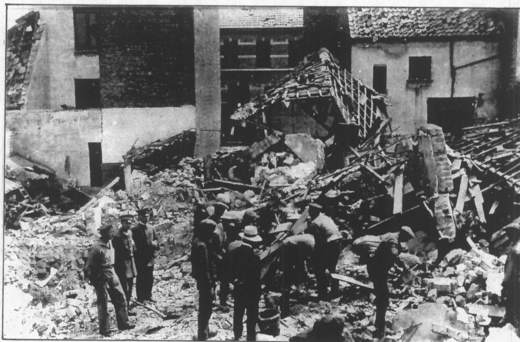
De Avisostraat. Ook de Duitsers staken soms een handje toe.