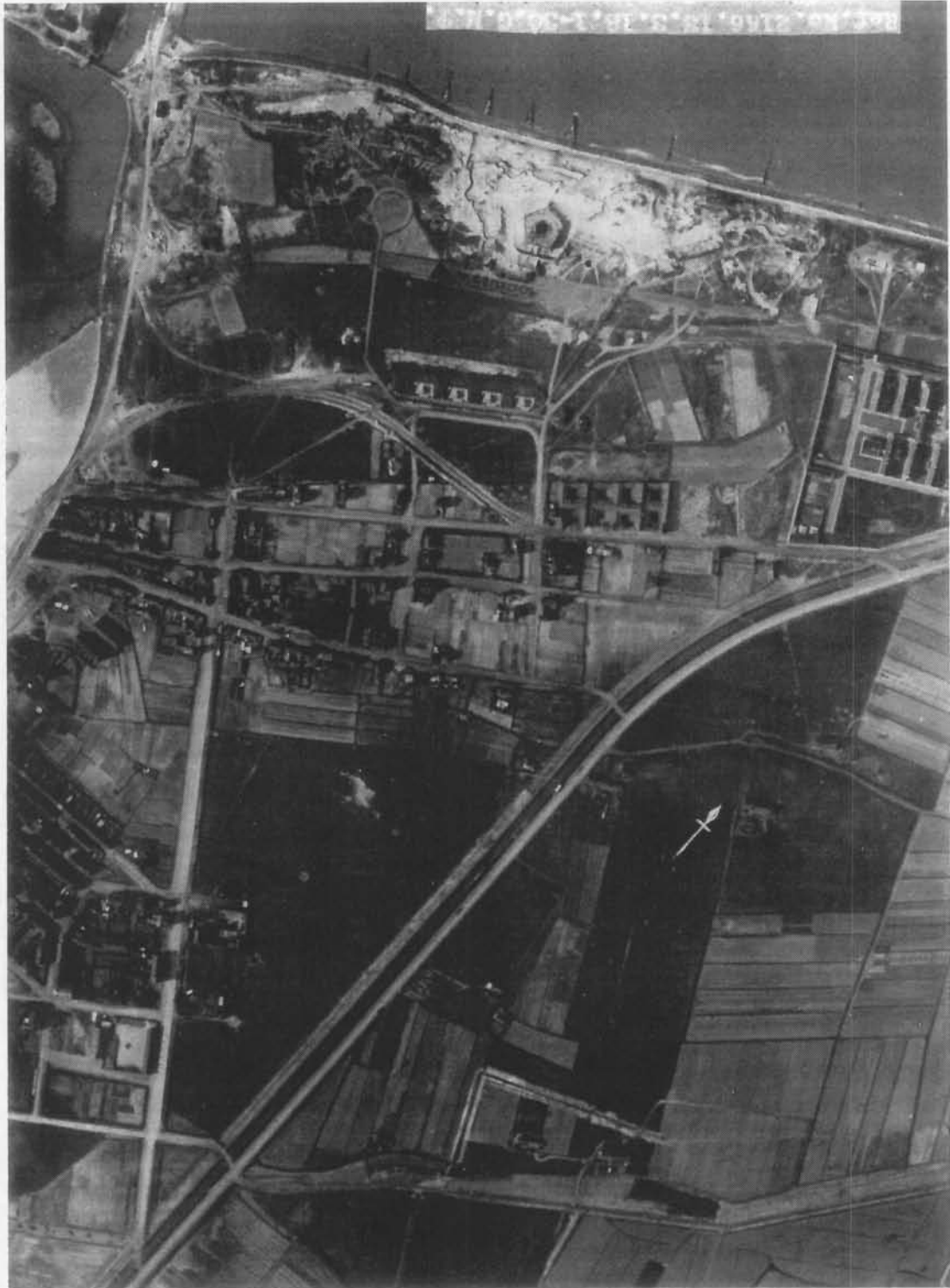
Luchtfoto van de Oude Vuurtorenwijk, de batterij Hindenburg en de vele versterkingen rond het fort Napoleon genomen op 13 maart 1918. Rechts onder de batterij, langs de Fortstraat: de "Boxen".