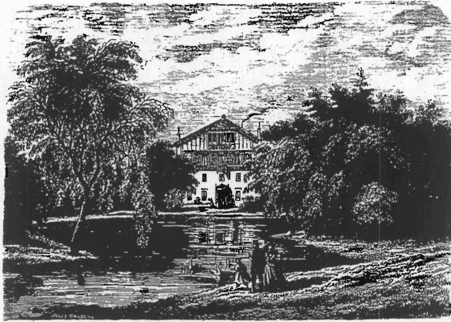
Fig. 100. Pavillon d'Armenonville.