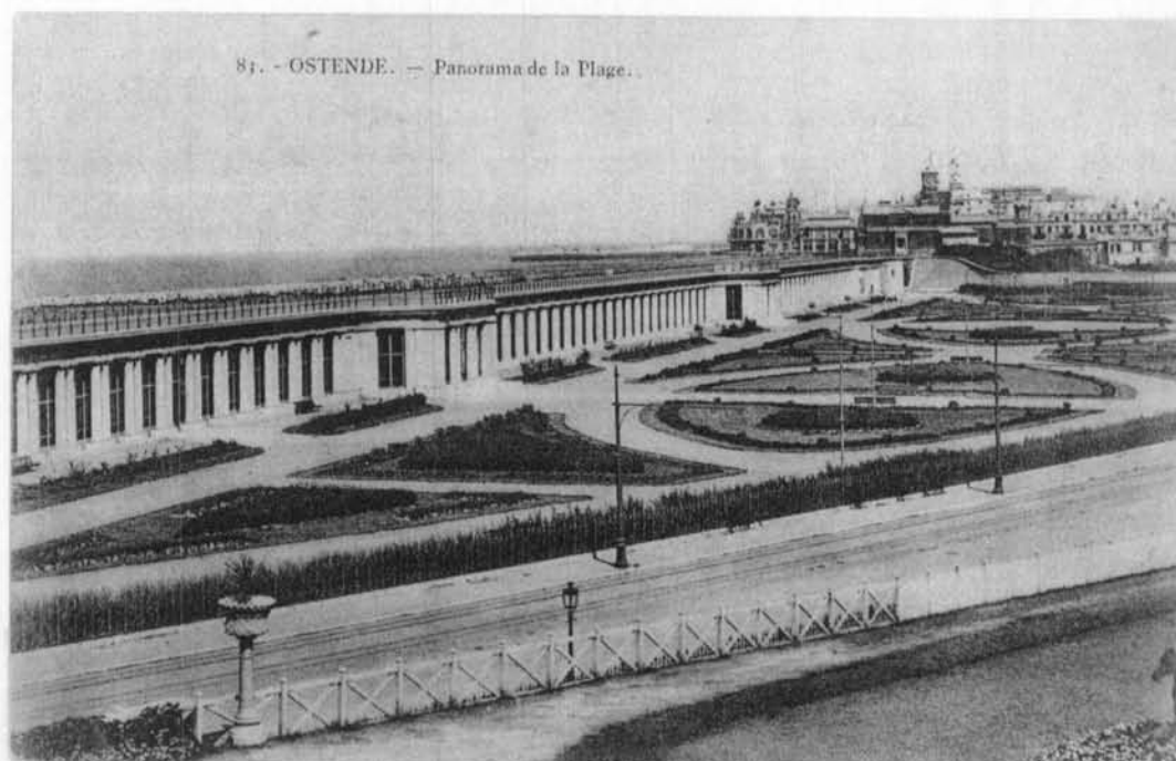
Panorama van het strand