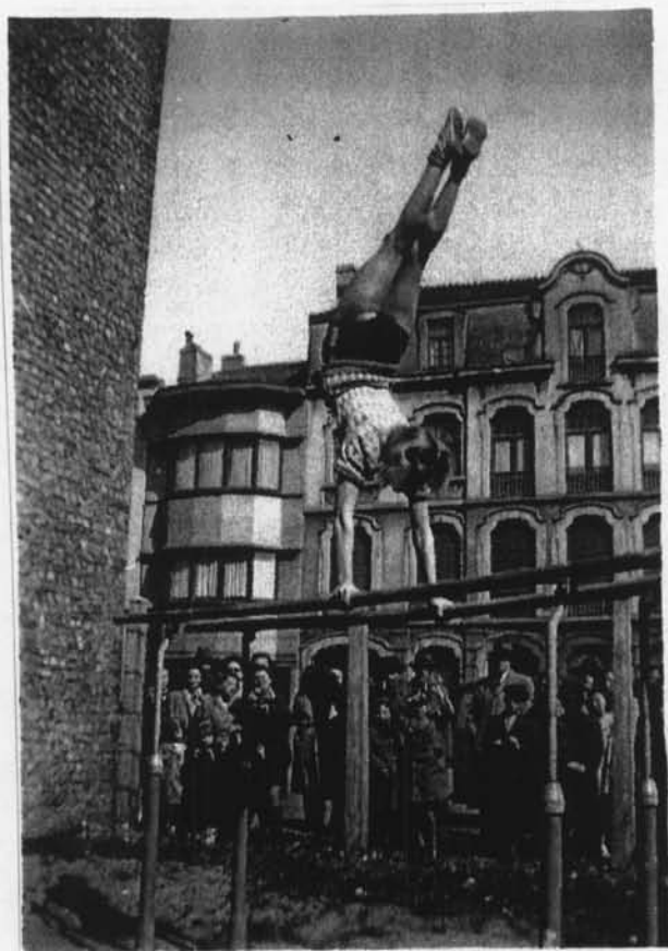
Germaine VANDERWAL in volle actie!