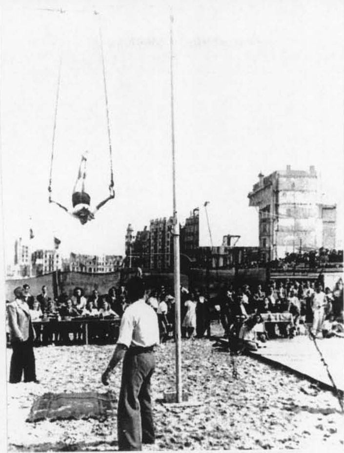
She flies through the air With the greatest of ease A daring young girl on the flying trapeze