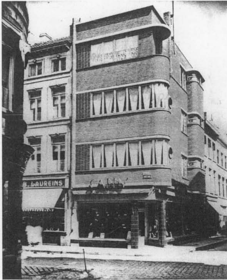
6 juni 1935: Opening confectiezaak Caddy, Kapellestraat 52. Ernaast nr. 50: schoenwinkel B. Lauwereins.