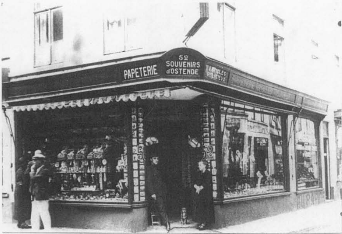
1920: souvenirwinkel op de hoek van de Kapellestraat 52 en de Sint-Paulusstraat