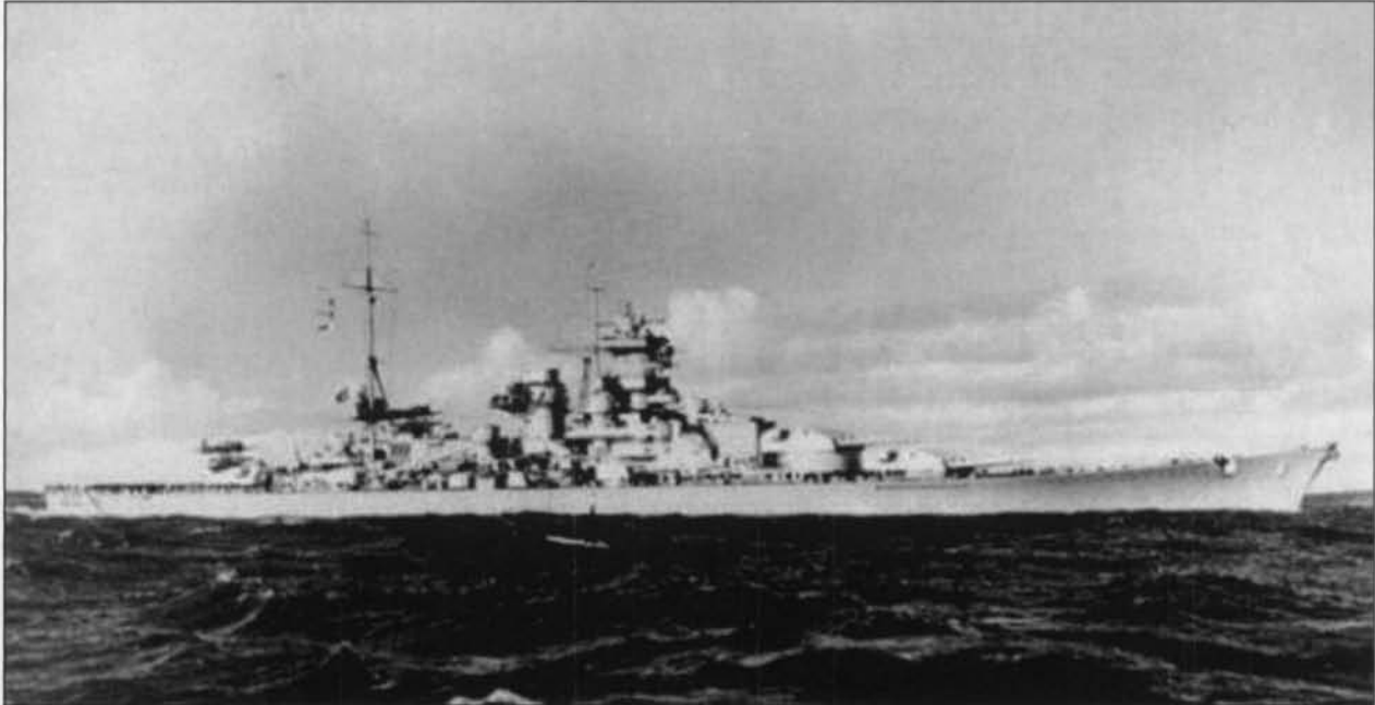
De Scharnhorst .

Om 16.47u beveelt admiraal Fraser de Belfast lichtgranaten af te vuren. Daarna vuurt hij van op een afstand van 11 km een eerste breedzijsalvo af met zijn tien 35.6 cm. kanonnen en lukt treffers. Jamaica bindt eveneens de strijd aan. De Scharnhorst vervolgt echter haar koers en vuurt regelmatig terug waarbij zij met haar zwaarste 28 cm. geschut, draagwijdte 40km930m, de mast van de Duke of York beschadigt. Ze zit echter klem tussen de twee eskaders van de Home Fleet .