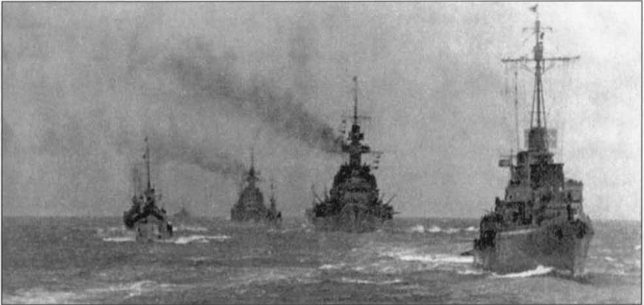
Een deel van het Bresteskader in het Kanaal. Vooraan rechts de torpedojager Z4 Richard Beitzen . Er achter de Scharnhorst gevolgd door de Gneisenau . Z25 sluit de formatie. Twee torpedojagers aan elke zijde beschermen de flanken.

Tijdens de doorbraak verliezen de Duitsers bij luchtgevechten 17 vliegtuigen en 11 piloten. Twee torpedoboten worden beschadigd: de T.13 van de 3 e torpedobootflottielje uit Duinkerke en de Jaguar van de 5 e torpedobootflottielje uit Vlissingen, beiden getroffen door bommen. Ook de Z29 van de 5 e Brestflottielje torpedojagers wordt beschadigd. Voorpostenboot V1302 van de 13 e flottielje zinkt na een luchtaanval. Het eskader betreurt twee doden, één op de Prinz Eugen en één op de Jaguar , en twee gewonden door bomscherven of machinegeweervuur.