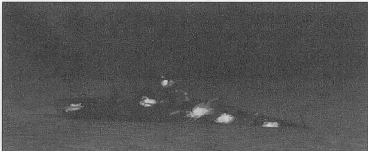
Scharnhorst zinkt (Animatie).