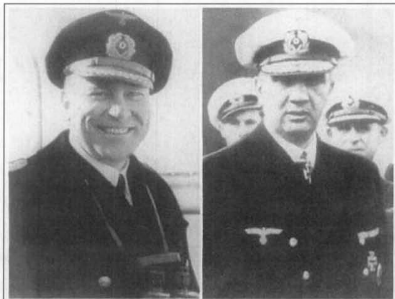
Kapitän-zur-See Fritz Hintze kapitein van de Scharnhorst

De Scharnhorst wordt afgemaakt. Om 19.28u staakt de Duke of York het vuur nadat ze op Scharnhorst haar 80° salvo afvuurde waarbij ze in het totaal 446 granaten verbruikte.