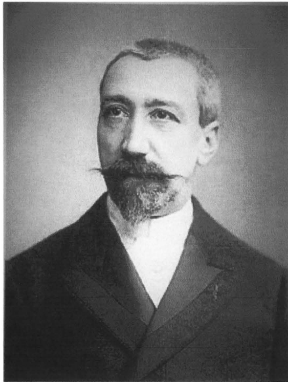
Anatole France bij het begin van zijn loopbaan. Portret door Wilhelm Benque.