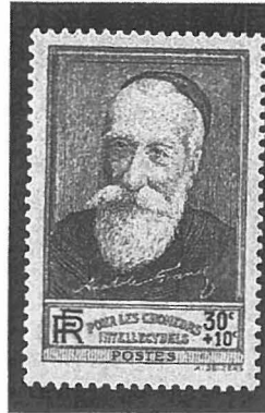
Franse postzegel met de beeltenis van Anatole France, uitgegeven in 1937 ten voordele van de werkloze intellectuelen (catalogus Yvert nr. 343). Dezelfde afbeelding verscheen in 1938 (Yvert nr. 380). (Verzameling Yves Dingens).