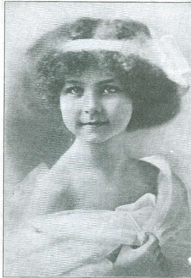
SOUVENIR DE LA FAMILLE ROYALE DE BELGIQUE S. A. R. la Princesse Marie-José de Belgique

's Avonds om 8 ½ ure ging eene lichtstoet uit aan denwelken al de maatschappijen van stad, zoowel katholieke als liberale, deelnamen. Vijf muziekmaatschappijen: Stadsharmonie, 't muziek van 't leger, de Katholieke Fanfaren (sic), de Harmonie der Jongelingscongregatie en de Fanfaren (sic) der Burgerwacht waren tegenwoordig. Veel volk was in den stoet aanwezig; eenige transparanten, alsook eenige groepen mieken den besten indruk, maar er was volstrekt gebrek aan orde. Om 10 ure werd een prachtig vuurwerk afgeschoten voor duizenden en duizenden toeschouwers.