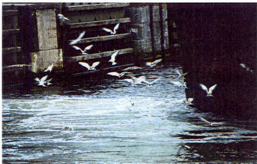
Figuur 3 Foeragerende visdieven bij de Westsluis

Vanaf de eerste week van juni werd er vrijwel uitsluitend gefoerageerd bij de sluisen, vooral bij de Westsluis, waar vanaf dat moment veel sprot aanwezig was. Het foerageren gebeurde vooral in het kolkende water in de sluiskolk en achter de boten op het moment dat een sluis open stond (zie figuur 3 (foto)). In het Kanaal van Gent naar Terneuzen werd gedurende de hele onderzoeksperiode slechts door enkele visdieven gefoerageerd. De observaties voor het bepalen van de foerageergebieden in 1999 gaven een soortgelijk beeld. De visdieven foerageren dus in dezelfde gebieden als in 1999.