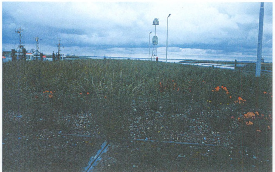
Figuur 1 Overzichtsfoto van de visdiefkolonie bij Terneuzen tijdens het broedseizoen van 2000

De exacte locatie en de kenmerken van de kolonie op het sluiscomplex bij Terneuzen zijn uitgebreid beschreven in het RIKZ rapport "Visdieven in problemen" (rapport RIKZ-99.037). Figuur 1 (foto) geeft een overzicht van de kolonie tijdens het broedseizoen. Als referentiekolonie werd de kolonie in de Vogelvallei op de Maasvlakte geselecteerd. Deze kolonie is ook beschreven in rapport RIKZ-99.037.