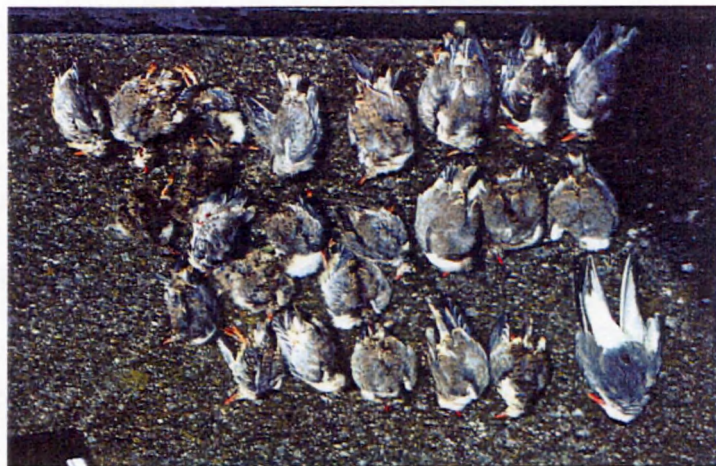
Figuur 5 Sterfte onder jongen

In totaal zijn er 113 dode jongen en twee dode adulte vogels aangetroffen in de kolonie. Deze sterfte vond voornamelijk plaats in de laatste week van juni (38 dode jongen) en de tweede en derde week van juli (70 dode jongen). Hoewel in juni alleen dode jongen van enkele dagen oud gevonden werden, werden in de tweede en derde week van juli vrijwel alleen dode jongen gevonden die op het punt stonden om uit te vliegen. De 31 dode jongen van 26 juni, de 15 dode jongen van 7 juli, de 10 dode jongen van 10 juli en de 24 dode jongen van 14 juli zijn verzameld en meegenomen naar het Rijksinstituut voor Kust en Zee te Middelburg voor mogelijke analyses. Figuur 5 (foto) toont de dode jongen en dode adult die aangetroffen werden op 14 juli.