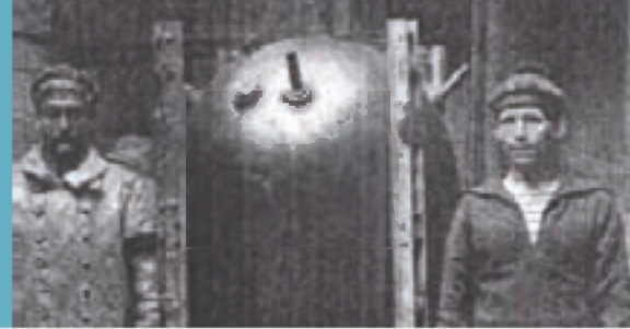
Mine, geborgen aus der UC61 (Chatelle & Tison, 1927)

Über 1500 flämische Wissenschaftler und Verwalter haben das Meer und die Küste zu ihrem beruflichen Wirkungskreis gemacht. Liegt Ihnen etwas auf dem Herzen, dass Sie immer schon gern über das salzige Nass, die Dünen, den Strand oder unsere Flussmündungen wissen wollten? Stellen Sie dann die Seefrage und wir suchen für Sie die Antwort!