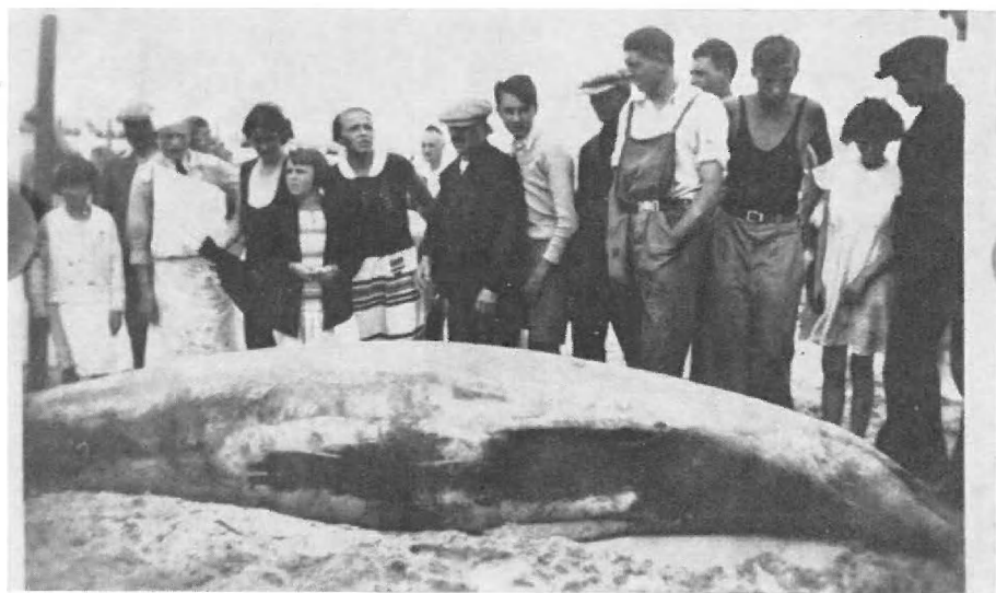
Fig. 2. — Mesoplodon bidens (SOWERBY) Wenduine, 20-VIII-1933.