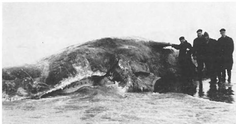
Fig. 2. — Physeter catodon L. De Panne, 19-XII-1954.