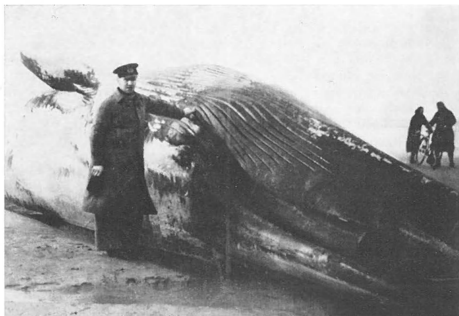
Fig. 2. — Balaenoptera physalus (L.). Oostduinkerke, 20-XI-1939.