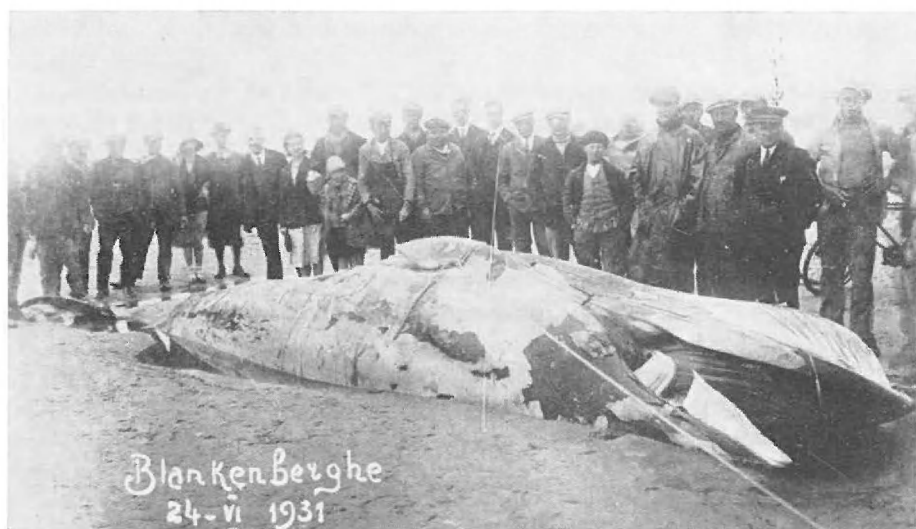
Fig. 1. — Balaenoptera acutorostrata LAC. Blanckenberge, 24-VI-1931.