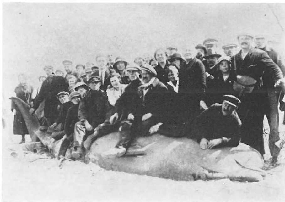
Fig. 1. — Hyperoodon ampullatus (FORSTER), wit specimen Wenduine, VIII-1925,