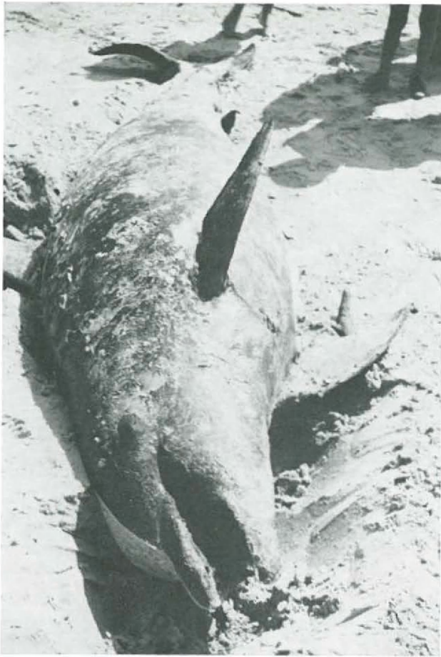
Fig. 1. — Tursiops truncatus truncatus (MONTAGU) Wenduine, 10-VI-1963.