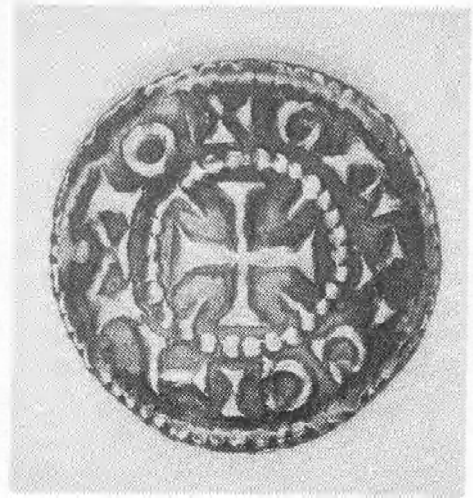
Fig. 3 : Karolingische munt, geslagen te Brugge.