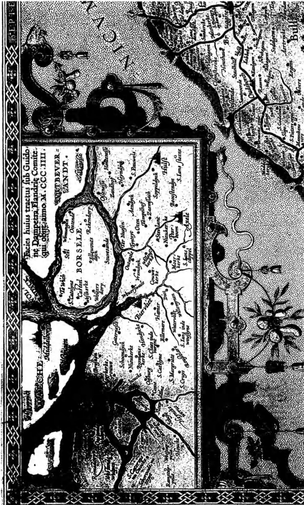
Fig. 7 : detail uit de kaart van Vlaanderen, gemaakt door Abraham Ortelius (1527-1598), uit "Theatrum Orbis Terrarum", Antwerpen, 1595.