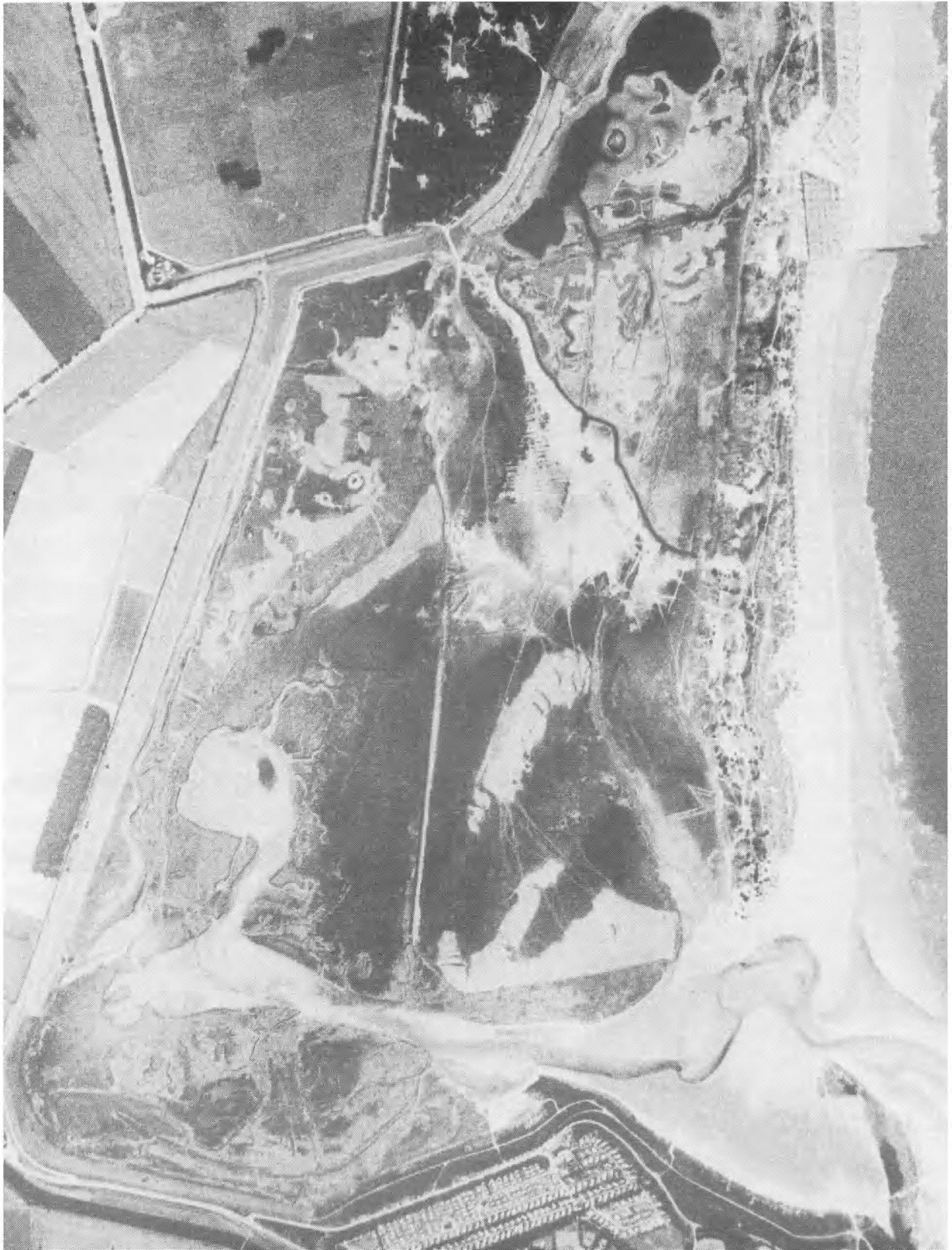
Fig. 2 : luchtopname van de huidige Zwindelta.