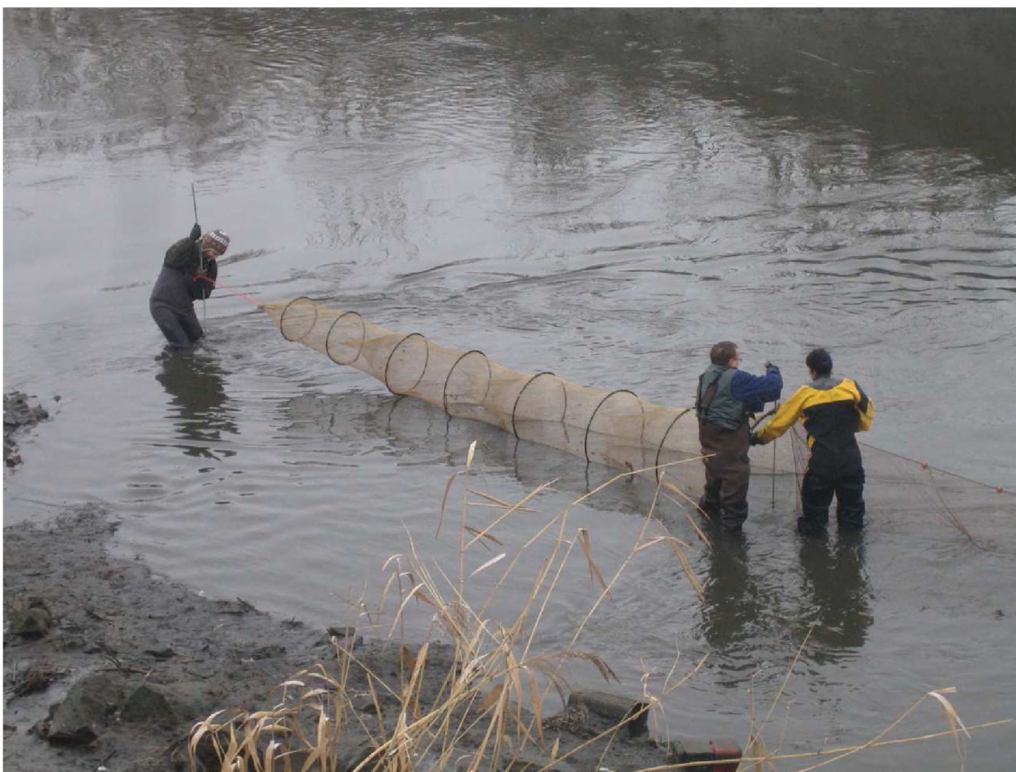
Figuur 2. Plaatsen van een dubbele schietfuis in de Zenne. De netten staan 48 uur op de laagwaterlijn en vangen vis bij hoog water. Om de 24 uur worden de fuisen leeg gemaakt. De vissen worden ter plaatse geïdentificeerd, geteld en gemeten.

Het visbestand werd bemonsterd met dubbele schietfuiken (type 120/80) (Fig. 2). Elke schietfuik heeft twee 7.7 m lange fuis, waartussen een net van 11 meter gespannen is. Een fuis bestaat uit een reeks van hoepels waar een net rond bevestigd is. De grootste hoepel vooraan (diameter 90 cm), die open is, heeft onderaan een afgeplatte vorm van 120 cm zodat de hele fuis recht blijft staan. Aan het andere uiteinde (maaswijdte 8 mm) wordt de fuis geopend en leeg gemaakt. Het overlanks net dat tussen de twee fuisen gespannen is, is bovenaan voorzien van vlotters en van een loodlijn onderaan, zodat het goed opgespannen kan worden. Vissen die tegen het overlanks net zwemmen, worden in één van de fuisen geleid. Binnenin de fuisen bevinden zich een aantal trechtervormige netten waarvan het smalle uiteinde naar achter is bevestigd. Eenmaal de vissen een trechter gepasseerd zijn, kunnen ze niet meer terug.