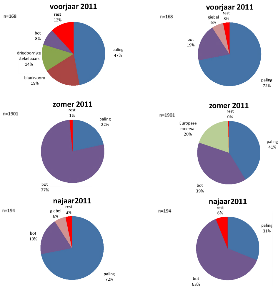
Figuur 3. Relatieve samenstelling van het visbestand in de Zenne volgens de voorjaar, zomer en najaar steekproeven in 2011. Links op basis van het aantal gevangen vissen ( n = het totaal aantal vissen in de steekproef), rechts op basis van de biomassa.

Opgesplitst per seizoen stellen we vast dat in het voorjaar 2011 paling het meest bijdraagt aan het totaal aantal gevangen individuen. In de zomer 2011 krijgen we een verschuiving naar bot, terwijl in het najaar opnieuw paling domineert.