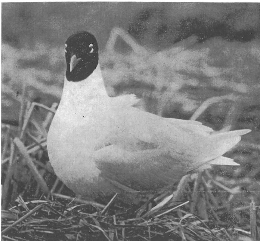
Zwartkopmeeuw op het nest.