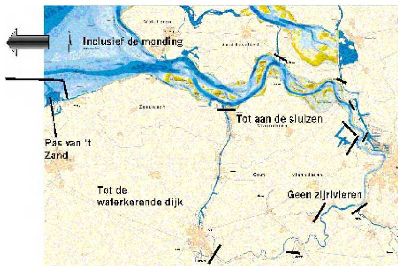
Gebied waarop de Langetermijnvisie betrekking heeft

Deze gebiedsafbakening is niet bedoeld als starre grens. Indien een thema dat noodzakelijk maakt wordt over de grenzen heen gekeken. De vastgestelde gebiedsafbakening is afgebeeld in onderstaande figuur.