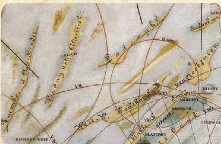
Fig. 2 Detail van de Blankenbergse visserskaart: de Lodewijkbank.

Op 18 november 2011 vond in het Stadhuis van Blankenberge een onthullingsmoment plaats van de "Zeekaart der Visscherij van Blankenberge". Het stadsbestuur, het St-Pieterscollege/St-Jozefshandelsschool en het Vlaams Instituut voor de Zee (VLIZ) stelden er de kaart voor in al zijn aspecten. Een reproductie van de kaart en place-mats t.b.v. Blankenbergse horecauitbaters zijn geproduceerd.