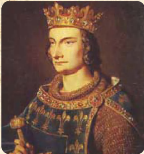
Fig. 1 Filips de Schone verbood al in 1291 het vissen met mazen kleiner dan een zilveren muntstuk (ca 2,5 cm). Bron: wikimedia commons .

De titel van deze bijdrage vermeldt dat het hier gaat over 'Belgisch' beheer. Voor referenties die dateren van voor 1830 (en dus van voor de stichting van de constitutionele monarchie België) worden beheersmaatregelen verstaan die van kracht waren binnen het geografisch gebied dat het huidige België omvat (of toch minstens de kustlijn ervan), of die betrekking hadden op de vissers die resideerden in dit gebied, ook wanneer ze in andere zeegebieden gingen vissen. De oudste maatregel aangaande de visserij die we konden terugvinden dateert uit 1291, wanneer Filips de Schone het vissen verbood met mazen kleiner dan een zilveren muntstuk (ca 2,5cm). Het betreft hier een verordening die we kunnen klasseren als een technische maatregel, en die in 1326 door Karel IV werd vernieuwd (fig. 1).