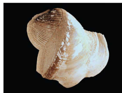
Schelp paalworm

Beide soorten kunnen van elkaar onderscheiden worden door verschillen in de vorm van hun schelpen. Deze 'boorkopschelpen' zijn opvallend klein: gemiddeld 1 centimeter bij de paalworm en 1,2 centimeter bij de scheepsworm. De vorm van de schelpjes kan bij de paalworm nog het best vergeleken worden met die van een ouderwetse brandweerhelm (zie figuur boven en foto rechts), waarbij het achterste deel van de schelp de vorm van een oor heeft. Bij de scheepsworm is de vorm van dit 'oor' groter en boven de rest van de schelp uitstekend (zie figuur onder) [7].