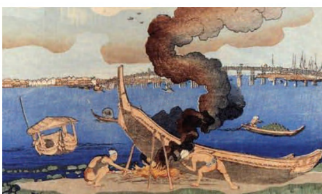
© William Pearl - Kuniyoshi Project Het dichtschroeven van een scheepsromp

Elke houten constructie diende vroeger beschermd te worden tegen paalwormen, ook wel 'termieten van de zee' genoemd. De allereerste technieken omvatten het dichtschroeven van scheepsrompen (zie tekening), het tijdelijk op het strand trekken van de schepen of ze voor langere tijd in zoetwater leggen [1]. De Chinese, Egyptische en Romeinse zeevaarders maakten al gebruik van chemische afwerende verven, of het beslaan van de houten panelen met koperen of loden platen [1,2]. Ook werden schepen gemaakt met een dubbele romp, waarvan bij beschadiging door paalwormen enkel de buitenste laag moest vervangen worden.