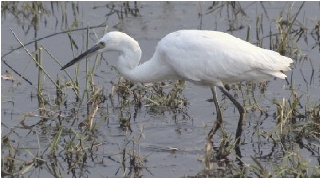
De kleine zilverreiger