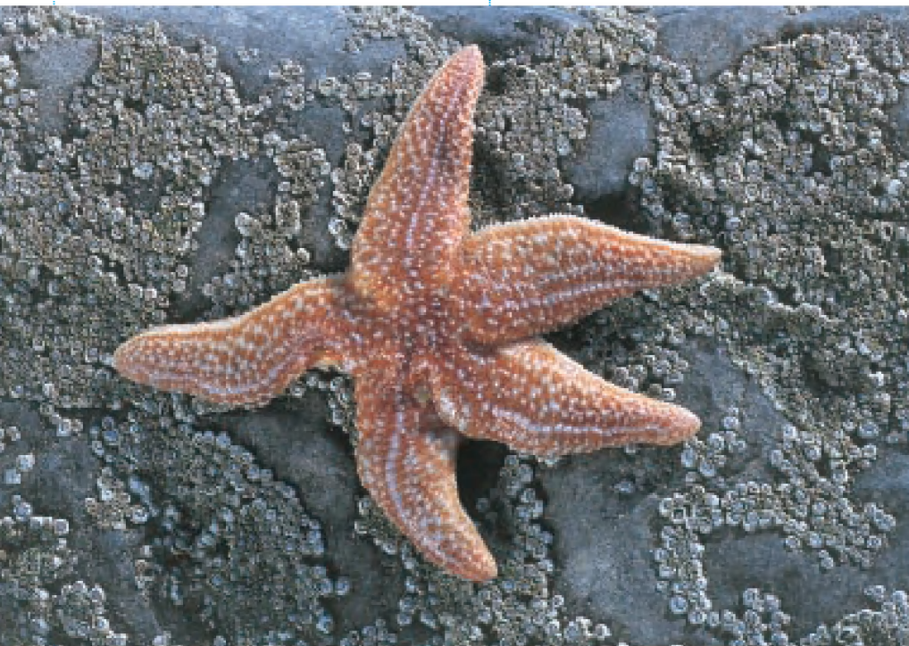
Asterias rubens is de meest bekende en meest algemene zeester van onze zeeën. Ze kan tijdelijk in zeer grote aantallen voorkomen op strandhoofden, waar ze zich voedt met mosselen, borstelwormen en kleine schaaldiertjes (MD).