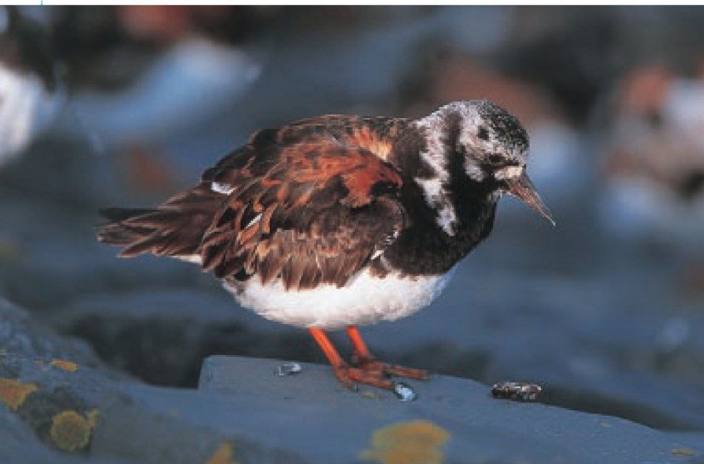
Stelllopers en meeuwen maken gretig gebruik van strandhoofden om er zich bij laag water te voeden. Eén van de meest typische stelllopers op strandhoofden is de Steenloper (MD)

rond een strandhoofd en verdringt er de inlandse Gewone Zeepok ( Semibalanus balanoides ). Meer zeewaarts komt een zone met mosselbedden ( Mytilus edulis ) voor. Recent worden ook steeds meer oesters aangetroffen op onze strandhoofden, voornamelijk op de meer beschutte plaatsen. De Oester Ostrea edulis is in onze streken quasi volledig verdwenen door de virusinfectie Bonamia en is er vervangen door de Japanse Oester ( Crassostrea gigas ), welke veel gekweekt wordt. De schelpdieren zijn dikwijls begroeid met Darmwier, Zeesla en Purperwier.