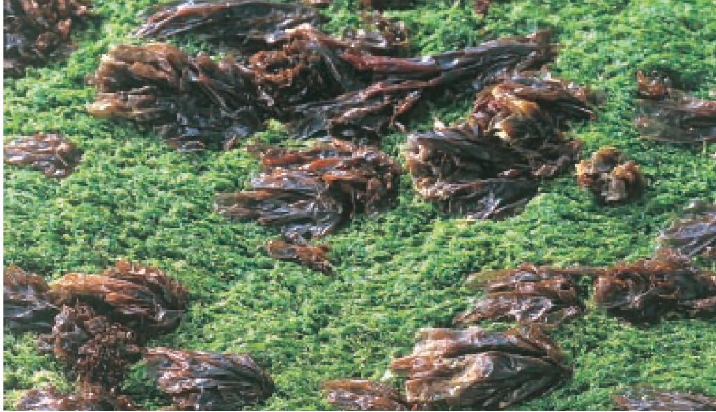
Op een strandhoofd komen Darmwier en Purperwier vaak samen voor (MD)

Meer naar laagwater toe komt een zone voor van dicht op elkaar zittende zeepokken. Vaak zijn ze bedekt met draadvormige kiezelwieren, die hen een bruine kleur geven. Zeer talrijk op strandhoofden is Elminius modestus , de Nieuw-Zeelandse Zeepok. Deze soort is na de tweede wereldoorlog langs onze kust opgedoken. Ze is blijkbaar zeer goed bestand tegen de schurende werking van het zand op en