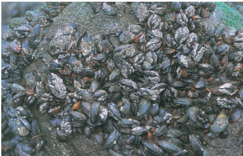
Klompens mosselen hechten zich vast aan de stenen constructie met behulp van hun baarddraden. Ze vormen een habitat voor vele andere organismen (MD)