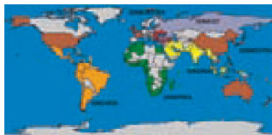
Fig. 6 De ODIN-netten omvatten nagenoeg alle IOC-lidstaten. Het Europese SeaDataNet is niet opgenomen

Het UNESCO/IOC-secretariaat zorgde er bij de start van de Ocean Data and Information Networks voor om van alle betrokken lidstaten het nodige engagement te bekomen zowel inzake personeel als infrastructuur van de datacentra. Terzelfdertijd verzekerde het IOC de vereiste capaciteitsopbouw bij de lidstaten door training 'on the job' te organiseren. Hierbij is de inbreng vanuit Vlaanderen cruciaal, mede omdat sinds april 2005 het UNESCO/IOC project office voor IODE haar activiteiten in Oostende opstartte. Sinds de oprichting van dit UNESCO expertisecentrum genoten reeds 800 experts uit 97 IOC-lidstaten een gespecialiseerde opleiding. Eenvormig opgeleide experts zijn cruciaal bij het uitbouwen van datanetwerken volgens de internationale opgelegde standaarden. Naar analogie met de succesvolle ontwikkeling van ODINAFRICA als pilootnetwerk, gevolgd door ODIN-CARSA, resulteerden deze 'on the job' trainingen in een versnelde opstart en ontwikkeling van nieuwe ODINs wereldwijd. Momenteel zijn er al zes ODIN-netwerken uitgebouwd en operationeel (figuur 6).