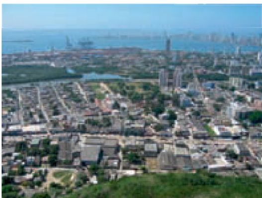
Fig. 5. Wereldwijd neemt de druk op kustgebieden door menselijke activiteiten enorm toe. Kleine kustdorpjes groeiden in 25 jaar uit tot een stadsagglomeratie in de baai van Cartagena, Colombia.

Vlaanderen opteerde ervoor om via het FUST het IODE programma te ondersteunen (in de fase 2003-2007 voor US$ 4,15 miljoen, destijds ongeveer € 3,32 miljoen) met specifieke aandacht voor het 'Ocean Data and Information Network' (ODIN). Dit activiteitenpakket bevordert een nauwe samenwerking tussen twee belangrijke