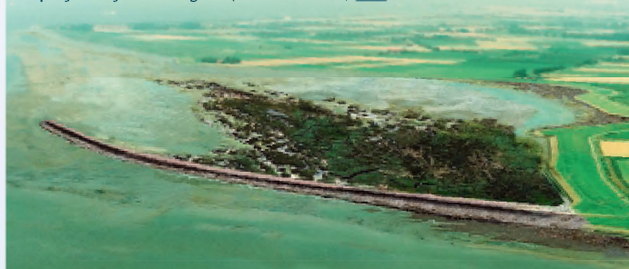
Artist-impression van een variant waartoe het buitendijkse natuurcompensatieproject bij het Zuidgors (Zuid-Beveland) had kunnen leiden.