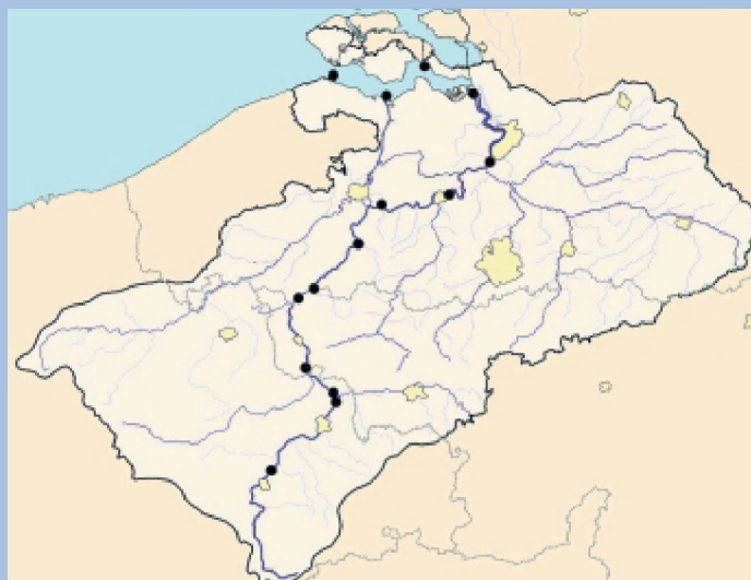
De veertien meetlocaties van het Homogeen Meetnet Schelde

In 1994 is het 'Verdrag inzake de bescherming van de Schelde' vastgesteld. De Internationale Commissie voor de Bescherming van de Schelde (ICBS) die daartoe werd ingesteld (zie kader op pagina 2) geeft invulling aan dat verdrag. Op 1 januari 1998 startte de commissie haar Homogeen Meetnet Schelde (HMS) op, waarmee ze de kwaliteit van de Schelde-rivier van bron tot monding monitort. Het ging daarbij om 18 algemene kenmerken zoals zuurstofgehalte, stikstof en fosfor. Geleidelijk is het meetnet uitgebreid – zo zijn er zware metalen en microverontreinigingen, zoals PAK's en bestrijdingsmiddelen toegevoegd – en thans bestaat