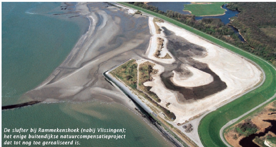
De slufte bij Rammekenshoek (nabij Vlissingen); het enige buitendijkse natuurcompensatieproject dat tot nog toe gerealiseerd is.

In 1995 sloten Nederland en Vlaanderen een verdrag over een verdieping van de Westerschelde om de toegankelijkheid van de havens van Antwerpen te vergroten. Voortaan moesten schepen tot een diepgang van 11,6 meter door kunnen varen, zonder rekening te hoeven houden met de getijdenwerking op de rivier. Vanwege de negatieve effecten op de natuur zijn in het verdrag ook afspraken gemaakt over nader uit te werken compensatiemaatregelen. Nederland is het oneens met de conclusie van de Europese Commissie (EC) dat de inhoud van het compensatieprogramma onvoldoende recht doet aan de Europese regelgeving. De uitkomst van die discussie bepaalt voor een belangrijk deel welke ruimte de door Nederland en Vlaanderen opgestelde Langetermijnvisie Schelde-estuarium biedt voor (verdere) aanpassingen in het estuariene systeem. Schelde Nieuwsbrief zet de feiten op een rij.