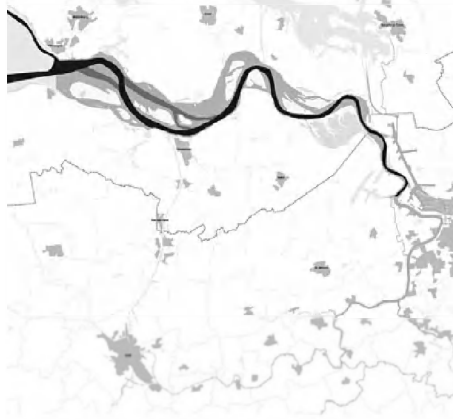
figuur 1.1 Het Schelde-estuarium