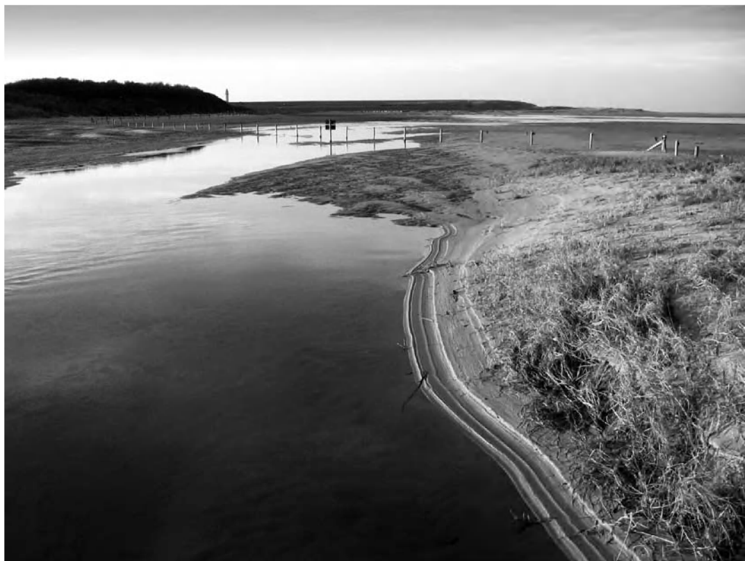
Verdronken Zwarte Polder