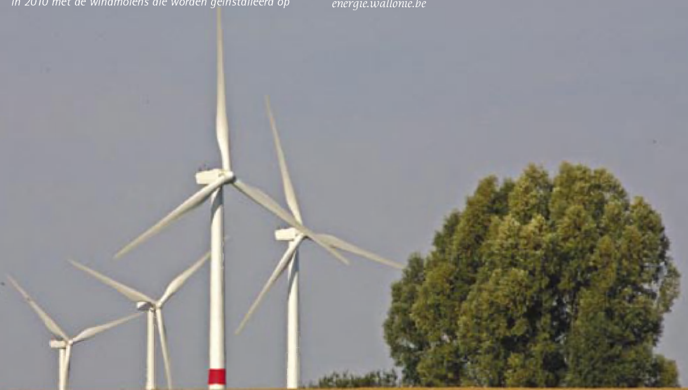
Windmolens in Waals-Brabant

Administratie voor Energie van het Waalse Gewest: energie.wallonie.be