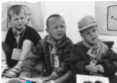
HE Jong zeegeweld

Onze kust is meer dan zon en strand tijdens de vakantie maanden. Zee, strand, duin en polder vormen een boeiend geheel vol natuur en cultuur. En daar willen talrijke partners de nodige aandacht aan schenken. Je vindt vast wel meerdere initiatieven waarop we je straks misschien mogen verwelkomen. Veel bezoekerscentra, werkingen en initiatieven zijn in het verleden ontstaan in de schoot van vrijwilligersorganisaties. De bezoekerscentra het Zwin (Knokke-Heist) en het Marien Ecologisch Centrum (Oostende) zijn zowat de pioniers aan onze kust. Ze stellen sinds jaar en dag de zee en haar omgeving centraal. Daarnaast staat het Centrum Voor Natuur- en milieueducatie (CVN) ondermeer in voor de vorming van natuurgidsen. Deze enthousiaste groep van mensen spoort de kustgasten aan om de natuur te beleven. De zee inspireerde ook de educatieve werking van de vzw. Horizon Educatief of bracht jongeren bij de Jeugdbond voor Natuurstudie en Milieubescherming