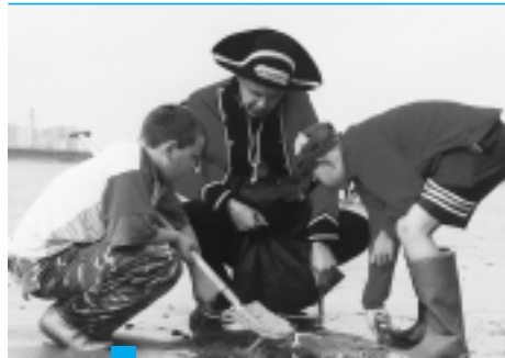
HE Veldwerk aan zee staat voor experimenteren, onderzoeken, gissen en missen, meten en vergelijken, graven en zeven...

Het is één van de vele praktijkvoorbeelden die aantonen dat wanneer partners samenwerken er veel mogelijk wordt! Stilaan groeien verspreid over de kust een aantal voorzieningen en centra waar de bevolking in het algemeen en het onderwijs in het bijzonder terecht kunnen voor ondersteuning en projectmatige samenwerking. Voor de verschillende bezoekerscentra ligt een belangrijke taakstelling weggelegd om samen met het steunpunt Natuur- en milieueducatie Middenkust verder te behartigen.