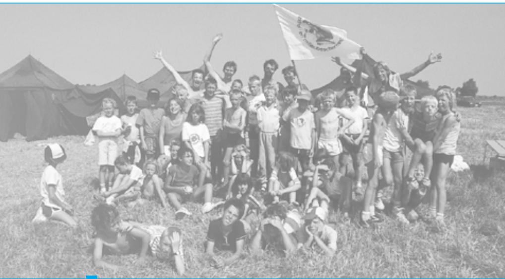
VL De Jeugdbond voor Natuurstudie en Milieubescherming (JNM): een organisatie met pit, die bijdraagt aan een betere kennis en bescherming van het milieu

Waar land en zee elkaar ontmoeten, ontstaat een fascinerend spel van eb en vloed met speelmogelijkheden voor strand, duin en polder. Kinderen, jongeren en volwassenen worden er uitgedaagd om de kustbiotopen op een actieve wijze te ontdekken. Duurzaam omspringen met het kustmilieu is er de heersende uitdaging. Om dit alles waar te maken ontpopte zich in de kuststreek een schat aan natuur- en milieueducatieve initiatieven die we graag even kort aan u voorstellen: