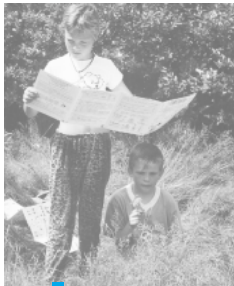
HE Zoekkaarten zijn een belangrijk onderdeel in de rijke buit aan lesmaterialen