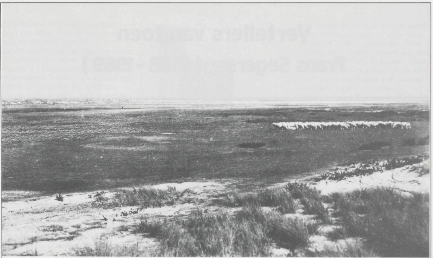
Het ongerepte Zwin met zijn kudde schapen, vastgelegd door Jean Massart op 6 september 1904

Over de schapen en hun herders in voorgaande eeuw werd in 1968 uitvoerig geschreven door Lucien Dendooven. Hieruit onthouden we dat de schapenteelt in onze zeepolders reeds sedert de Middeleeuwen zeer belangrijk geweest is.