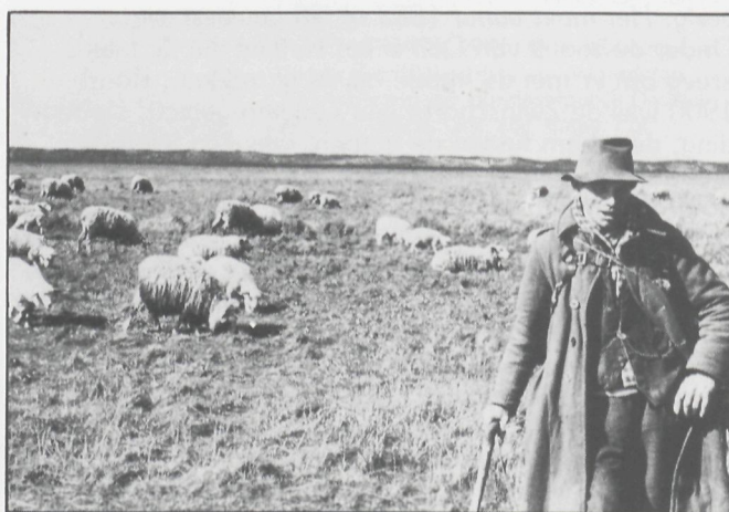
Kamiel en kudde in de Zwinschorre in 1945

'In mijn stal zijn zowat 6 000 lammeren geboren. Ik heb karrebakken kinderen in de buurt zien groot worden. Zes soldaten en een loteling zag ik uit De Vrede naar de oorlog gaan en terug thuis komen. In 1918 heb ik al mijn schapen door de Duitsers zien wegnemen: 90 belammerde schapen en 60 lammeren. Dan heb ik 25.000 mensen naar Holland weten vluchten. Zes vonden hun weg, want daar stond de oude wegwijzer al sedert 1839. En in de jaren werd de paraplu van boven mijn kop gekapt, de mooiste kromme olmboom van Knokke'. Er pinkelde een traan uit zijn oog: 'Ik begin vergeten te worden'. □