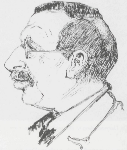
Jac. P. Thijssse