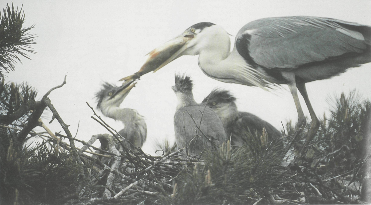
Oudervogels braken het voedsel in de bek van hun hongerige jongen