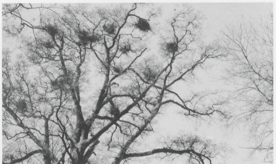
Reigernesten zitten veelal hoog in de boomkruinen