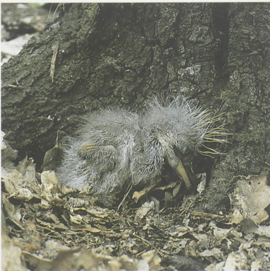
Dit reigerijtje overleefde de val uit het hooggelegen nest niet. Een windstoot doofde zijn hulpeloze leden...