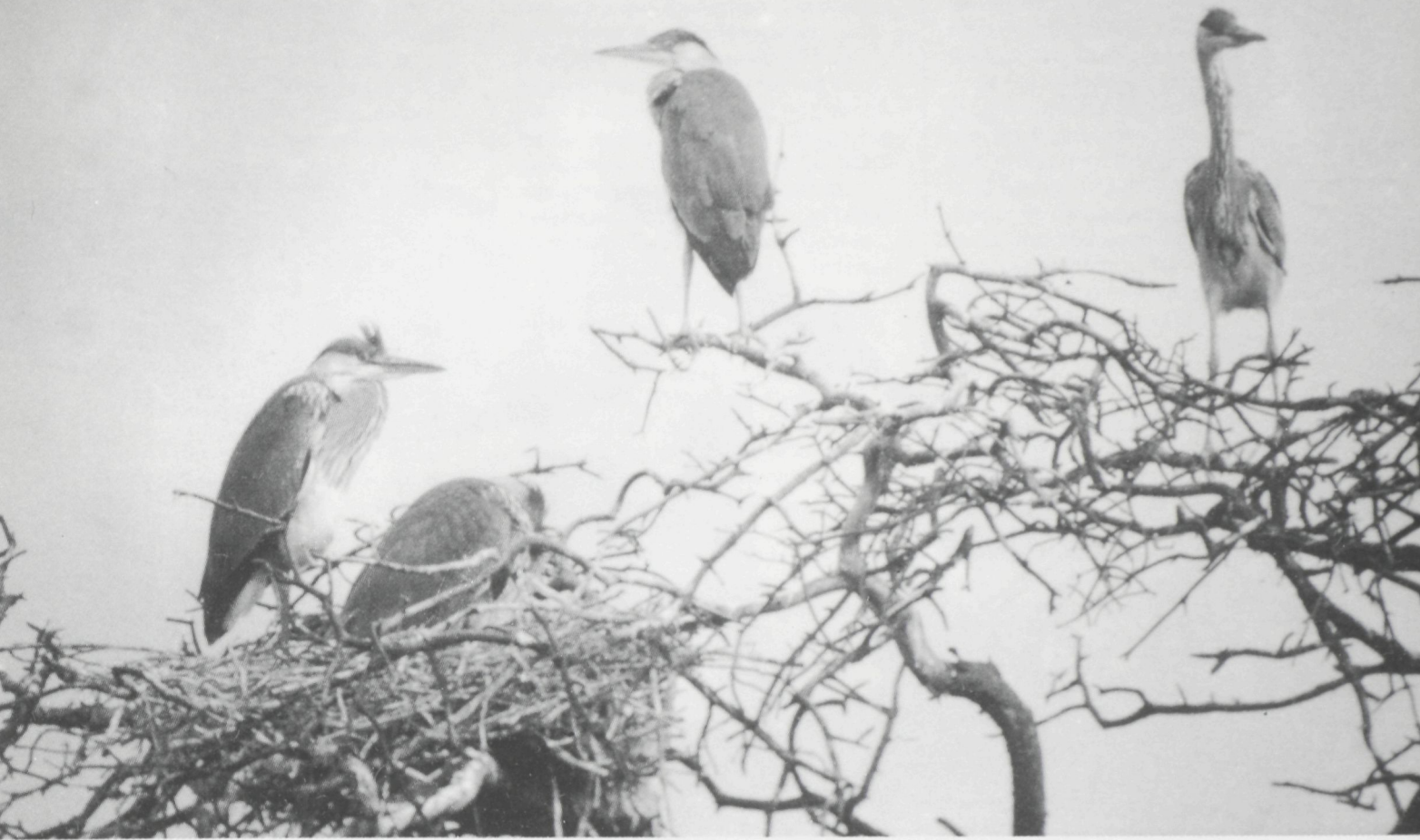
Suffers en bouwers, in een reigerie loopt alles dooreen