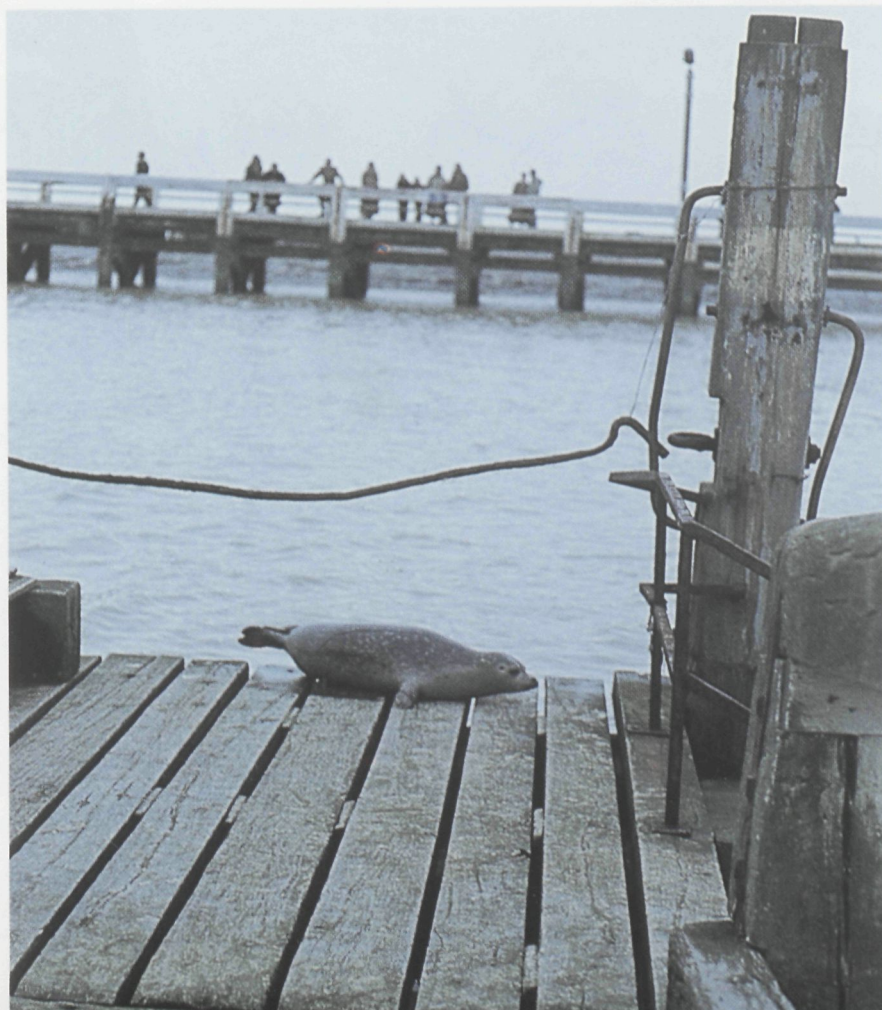
Jong zeehondje duttend op het staketsel van de havengeul in Blankenberge