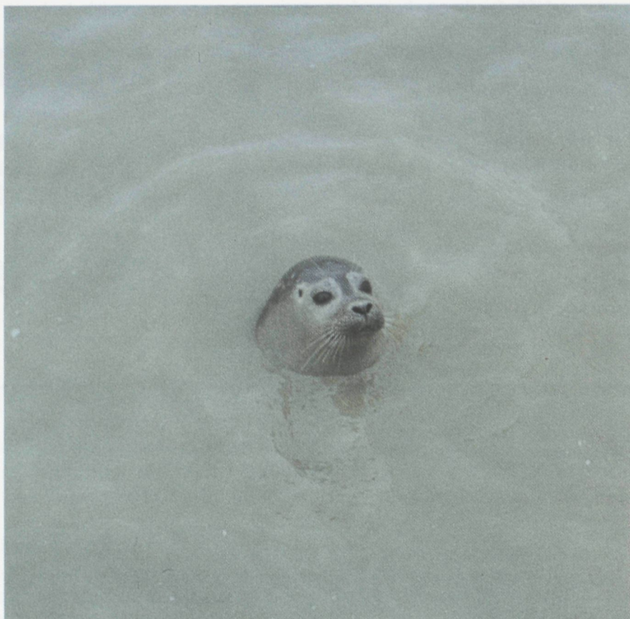
Jonge zeehond in de Blankenbergse havengeul

De jonge dieren die hier aankomen, zijn na een soms wekenlang verblijf in volle zee, vaak ziek of gewond. Rustend op het strand of een golfbreker kunnen ze dan ook makkelijk benaderd en gevangen worden. In de jaren vijftig en zestig werden ze soms als attractie in viswinkels gehouden, bijvoorbeeld in Blankenberge (1955), Knokke (1957) en Nieuwpoort (1966). Dit laatste leefde er 2,5 jaar in gevangenschap. Meerdere zeehonden werden ook overgebracht naar de Zoo van Antwerpen en vanaf '73 ook naar het Dolfinarium van Brugge. De meeste overleefden hun avontuur niet lang. Toch zijn er meevallers . Zo verblijven er momenteel twee in het Dolfinarium te Brugge die als jong aanspoelden in '73 en '74. In augustus '82 brachten ze een jong ter wereld. Ook in de Zoo van Antwerpen werden al meerdere jongen met succes opgekweekt.