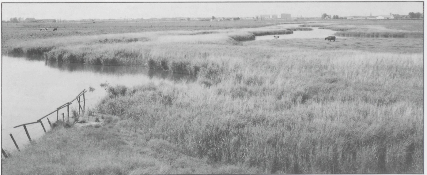
Een prachtig natuurgebied, de Zoutekreek nabij Zandvoorde. Op de achtergrond Oostende

Eind 1980 werden in opdracht van het Oostends stadsbestuur werken aangevat voor 'recreatieve ontsluiting'. Rietkragen werden het water ingeduid, oevers werden met azobehout versterkt, een twee tot drie meter breed pad werd tegen de waterkant aangelegd, de natuurlijke vegetatie werd de grond ingeplougd, gras werd ingezaaid en sierheesters besteld. Ook zou een zestig meter lange steiger met zitbanken en verlichting ver in het water lopen en voor een breed panorama moeten zorgen. Een schrijnende ingreep voor meer 'groen'. Het spel werd hierbij grof gespeeld, want degenen die tegen deze gang van zaken opkwamen, werden keer op keer met een kluitje in het riet gestuurd, terwijl