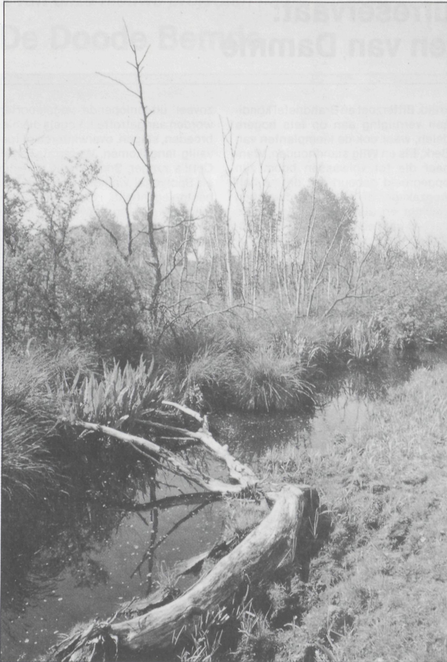
Afsterven en heropgroei van elzenberkenbos

De eerste taak van een verantwoord natuurbeheer zal er hier in bestaan de huidige structuur en de absolute rust van dit goed bewaarde terrein angstvallig te behouden.