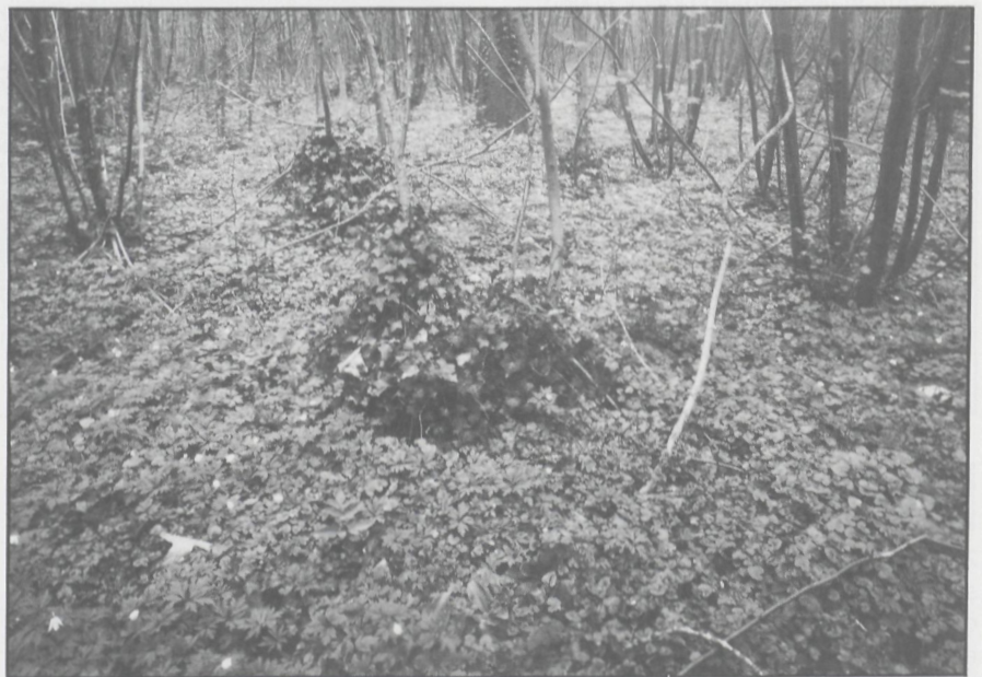
Het fraai aangelegde park rond het kasteel: Engelse landschapsstijl, met als 'inlanders' ondermeer Beuk, Zomereik, Esdoorn, Hulst, en als exoten Plataan, Tamme kastanje, Tulpenboom. Op de voorgrond o.a. Stengelloze sleutelbloem en Bosanemoon.

biologische studie. Onuitgegeven lic. verhandeling. R.U.Gent, 103 p.