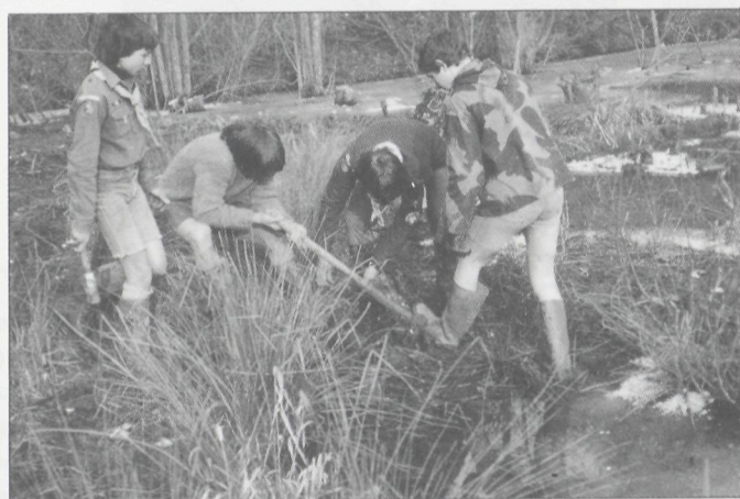
Ongewenste wilgenopslag wordt verwijderd.

Ook sommige vogels profiteerden van deze ingrepen. De Dodaars ( Podiceps ruficollis ) broedt er nu en duikeenden vinden er een geschikte pleisterplaats: een Tafeleend ( Aythya ferina ) werd er tijdens de trek opgemerkt en een vijfje Brilduiker ( Bucephala clangula ) verbleef er tussen