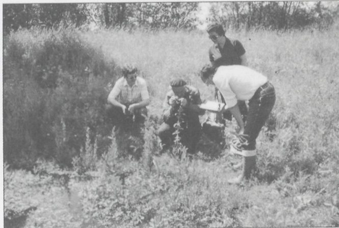
Leden van het beheerscomité op onderzoek.