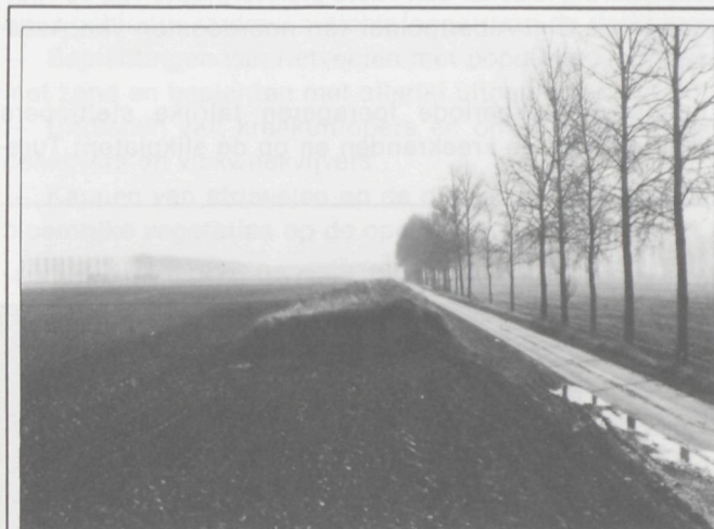
Slapersdijken worden soms afgegraven.

ertussen talrijke braamsoorten. Lianen van Wilde kamperfoelie en Hop slingeren zich de hoogte in. Op bepaalde plaatsen vinden we in de kruidlaag een aantal min of meer kalkminnende soorten zoals Wilde marjolein, Borstelkrans, Donderkruid, Glad parelzaad, Aardaker, Pastinaak en Knautia. Ook Breedbladige wespenorchis en Keveorchis komen er voor.