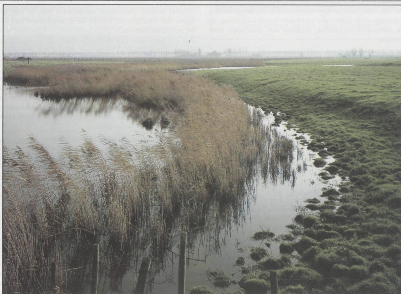
Uitloper van de Oostpolderkreek.

Bij het ontstaan van het landschap was het vooral de latere Duinkerken III-transgressie* (11de-12de eeuw), die hier een grote invloed heeft gehad. Na de 12de eeuw werden grote delen ingepolderd en ontgonnen. In 1375-76 sloeg een stormvloed een brede bres in de noordelijke dij-kengordel, die door de slechte economische toestand van die tijd onvoldoende onderhouden was. Hierdoor ontstond een binnensee, de Zuidzee (ook Dullaert genoemd), die ten westen en ten zuiden begrensd was door de reeds bestaande Grave-Jansdijk en verder door een dekzandrug tussen Bentille en Boekhoute (de Heerst). Een vloed in 1394 en de beruchte Sint-Elizabetsvloed in het begin van de 15de eeuw lieten steeds meer land verloren gaan. Door al deze stormrampen ontstonden diepe kreek die door de getijdenwerking nog verder uitgediept werden. Na een moeizaam herinpolderen, werden een aantal dijken in 1583 om strategische redenen doorgestoken tijdens de 80-jarige oorlog. Een nieuw krekensysteem vertakte zich vanuit het oude en het gehele gebied werd opnieuw over-