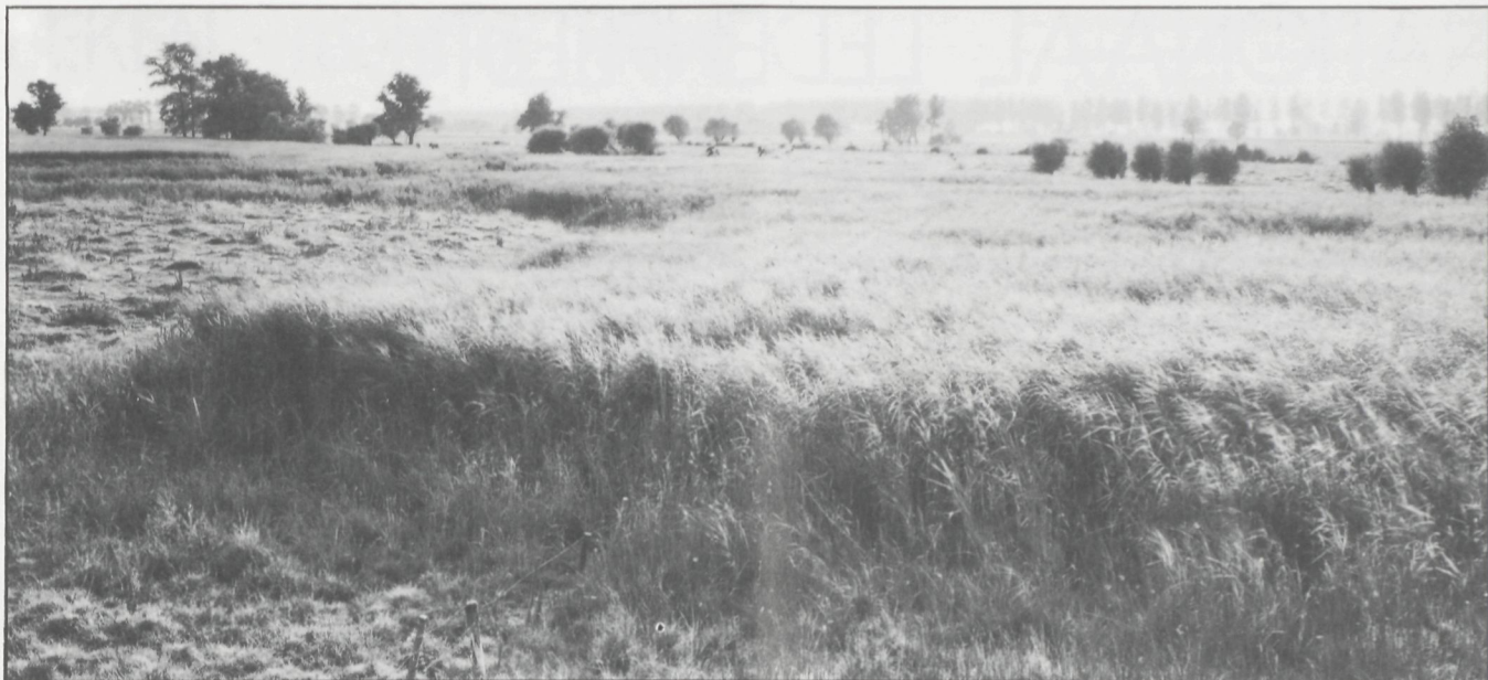
Kreek bij de Blauwe Sluis

buitenlandse, vooral Franse jagers, die zich ook van beschermde soorten niets aantrekken.