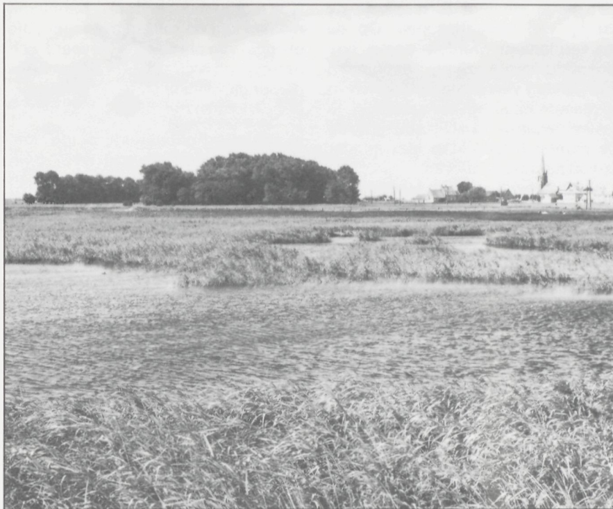
Kleiuitgraving te Stuivekenskerke

maar niet te dicht aaneengesloten begroeiing. Met zijn lange poten kan de Grutto zich in dergelijk terrein gemakkelijk voortbewegen, terwijl hij er zich tijdens het broeden goed kan in verbergen. In optimale omstandigheden kunnen echte kolonies gevormd worden.