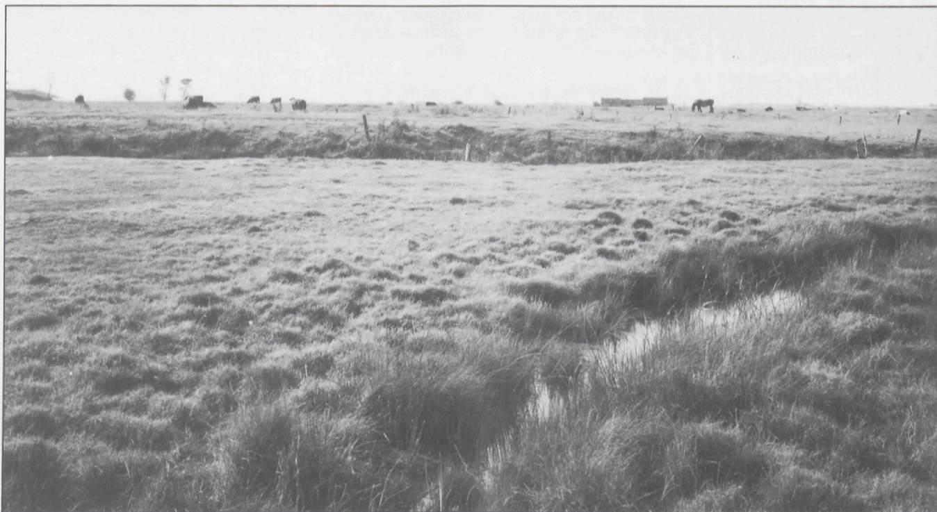
Uitvening in de omgeving van Stalhille

Ook door het afgraven van polderklei voor het maken van baksteen ontstonden kunstmatige diepten, echter