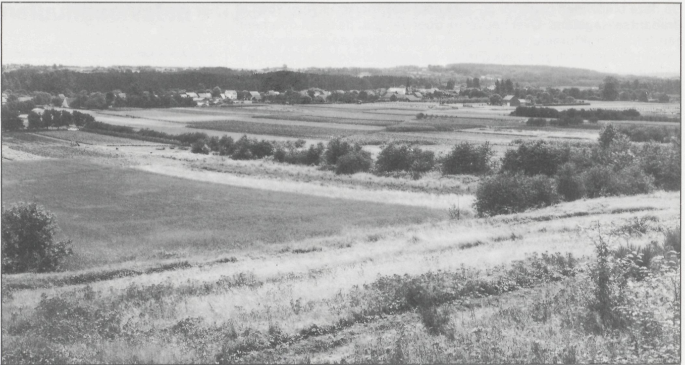
Houwaart met links het Walenbos en op de achtergrond de Roeselberg

deze Hagelandse heuvels vrij snel overwoekerd door Gewoon struisgras.