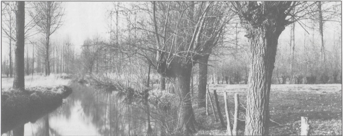
De Marcke te Galmaarden