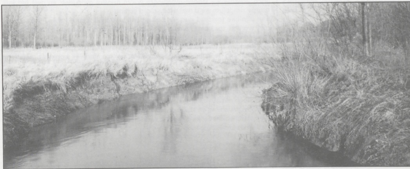
De Dijle te Neerijse

pelhout of hoog loofhout. Samen met de begroeide taluds en de holle wegen brengen ze afwisseling en biologische rijkdom in dit landschap. De holle wegen en graften herbergen daarbij soorten die we veeleer in kalkgraslanden verwachten, zoals Wilde Tijm en Marjolein; ook het Rapunzelklokje, Betonie, Knolsteenbreek, Knautia en Goudhaver vinden daar een onderkomen. Maar ook hier zit niet alles pluis, want wegverhardingen, stortingen en rooingen dreigen de kop op te steken.