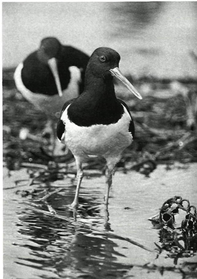
Een onverwachte verschijning: de Scholekster

Wanneer een « come back » voor deze soort? Ook de Ransuil ( Asio otus ) scheen ons - om dezelfde reden? - in 1979 verlaten te hebben. Een voor dit reservaat vermeldingswaardige observatie was de waarneming van een vijftal fouragerende Scholeksters ( Haematopus ostralegus ) op 26 april. Toen ik die dag op weg was naar het reservaat, werd mijn aandacht reeds vanop vrij grote afstand gevestigd op de voor deze soort typische luidruchtige roep « te piet, te piet, te piet ». Dit geluid klonk mij op dat ogenblik vertrouwd in de oren, daar ik net van een verblijf op het waddeneiland Textel terug was waar deze waadvogel veel voorkomt en waar zijn roep dan ook dag en nacht te horen is. Niet zonder reden is deze vogel dan