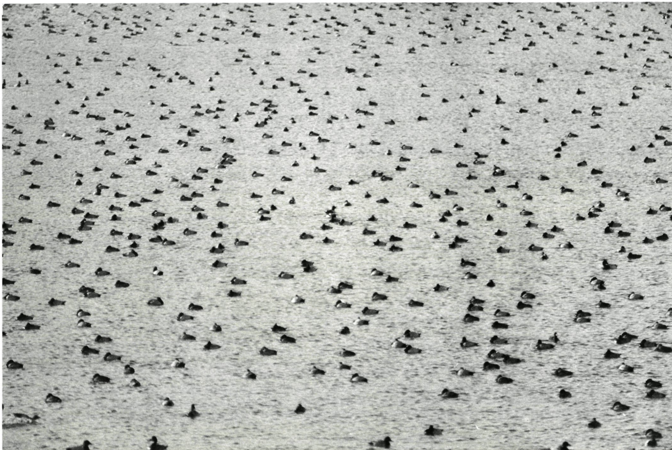
Watervogels pleisteren en overwinteren vaak in grote concentraties

Deze soorten behoren alle drie tot de groep der zwem-eenden, die in tegenstelling tot de duikeenden zwemmend of grazend aan de kost komen.