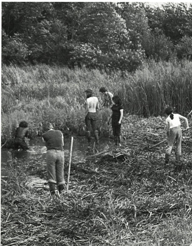
Natuurbeheer door vrijwilligerswerk

Het succes van de cursussen te Antwerpen, Brugge en Tienen mag zeker niet onvermeld blijven. Tesaamen met de verzekering, het cursusboek en het ter beschikking komen van een klein materiaaldepot kan het een stimulans zijn voor de totstandkoming van permanente beheerswerkgroepen.