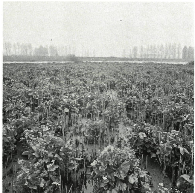
Bloeiende Dotterbloemen in de Rietsnijderij