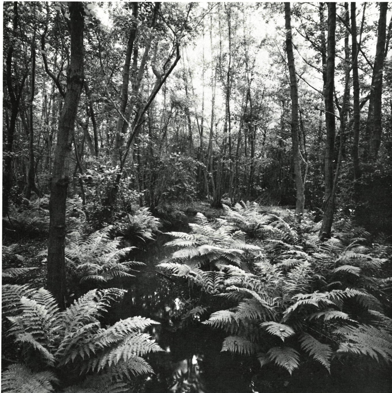
Vallei van de Zwarte Beek: een Limburgs pareltje

Van de eigen uitgaven dient alleszins de syllabus « Natuurbeheer en Vrijwilligerswerk » vermeld te worden. De eerste uitgave van dit handboek voor natuurbeheer,