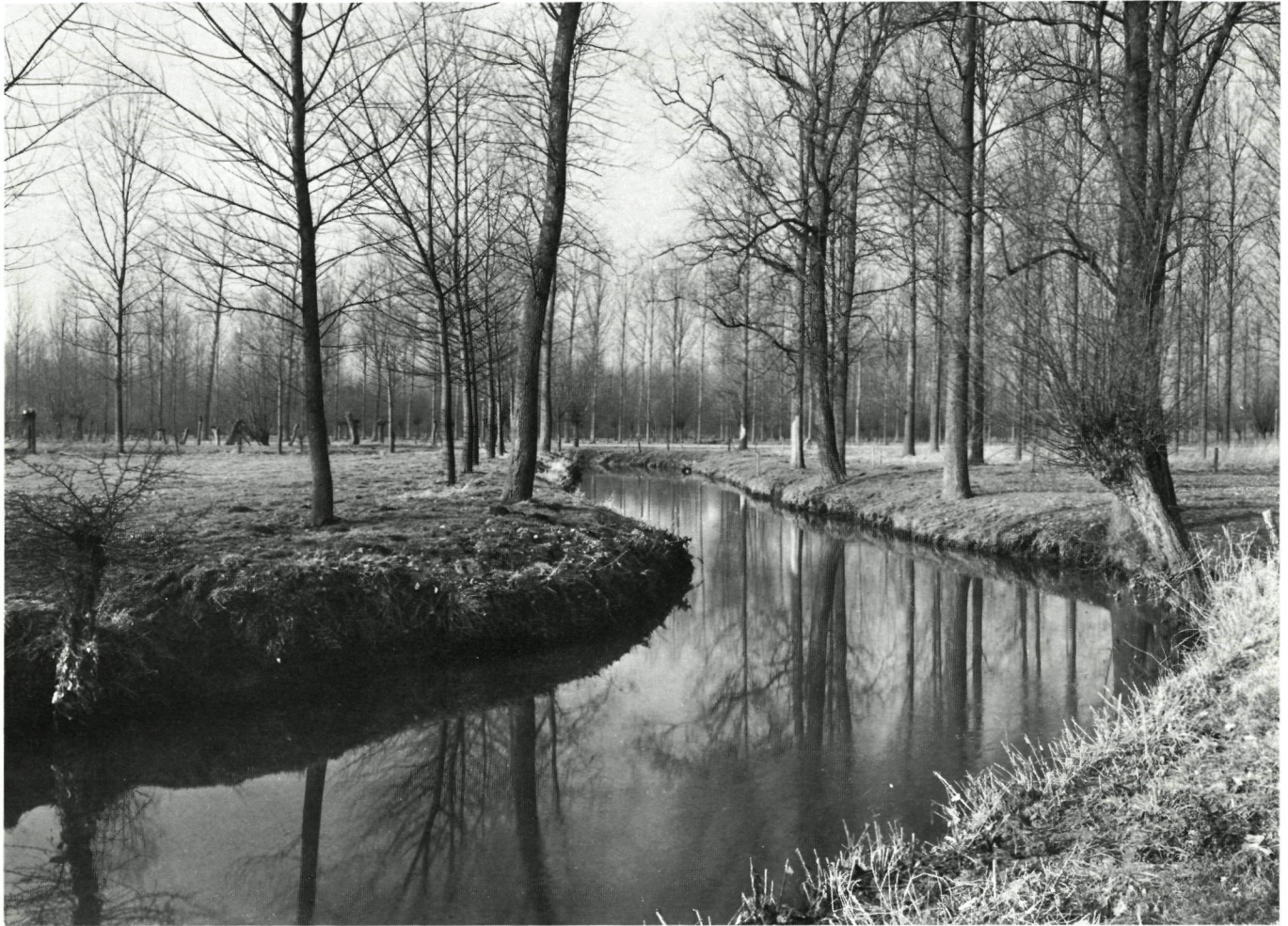
Mede door onze tussenkomst werd kanalisering van de Marcke (voorlopig) voorkomen

dende bossen en heide, grenzend aan het militair domein van Leopoldsburg.