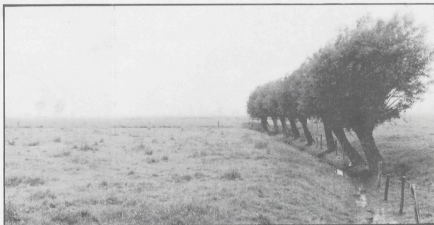
De polders bij de Blankaart

landbouwer deed: riet maaien en hout kappen. Hoewel vroeger op de Blankaart dergelijke menselijke beïnvloeding plaats greep, werd deze bij de oprichting van het reservaat tot een minimum herleid. Sedert enkele jaren wordt echter terug botanisch beheerd, vooral met het doel de verruiging, die zich in de rietlanden sterk heeft doorgezet, tegen te gaan.