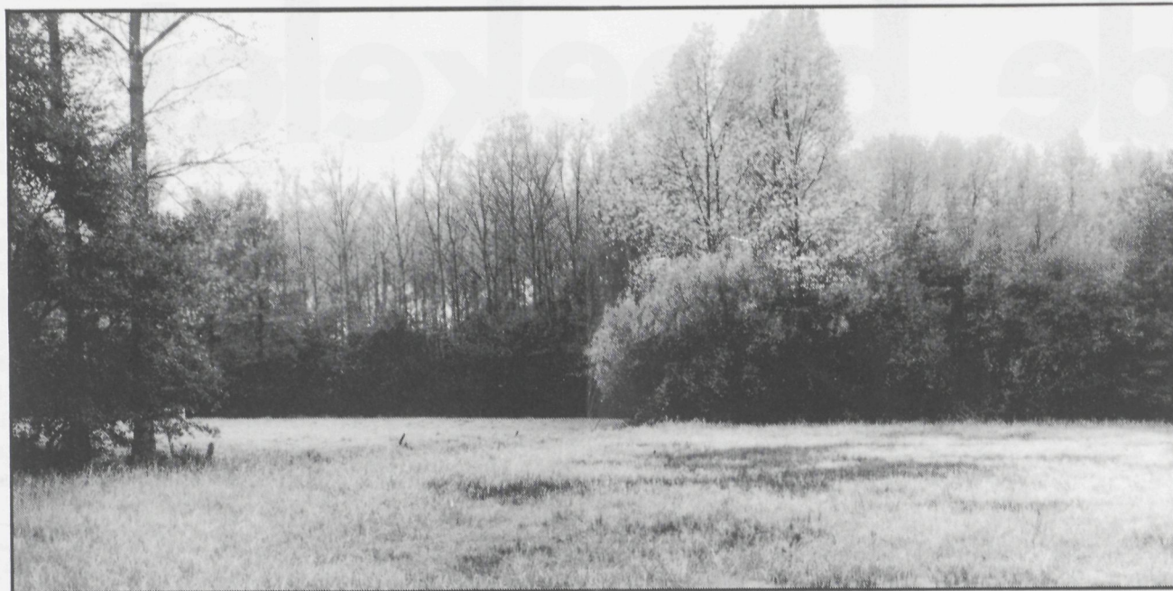
Deze hooilanden komen regelmatig blank te staan

Op het gewestplan kreeg de Broekelei de bestemming : recreatiegebied, bosgebied, woonpark, landbouwgebied en woonuitbreidingsgebied !