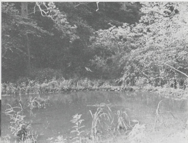
De vijver van Rognac.

Toen het Ardens woud door ontbossing werd verbrokkeld, bleef de Grande Vecquée nog eeuwenlang een aaneengesloten geheel van enkele duizenden hec-