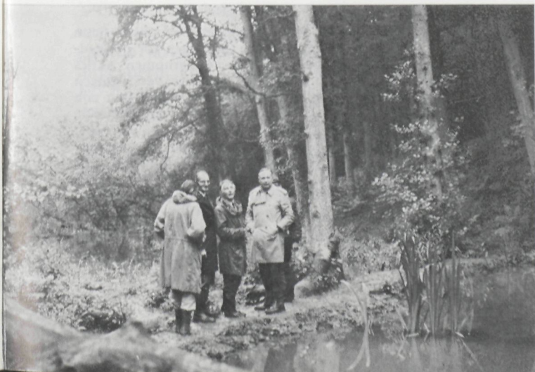
De akte van schenking werd zoëven getekend...

Oktober 1978. — Het dal werd vrijgemaakt en het licht kan nu overvloedig binnenstromen. Rognac is een bronnengebied bij uitstek en er ontspringen een twaalf-tal beekjes, die alvorens zich in de voornaamste waterloop uit te storten, even een halte maken in ondiepe vijvers. Hun water is zo kristalhelder, dat er onder invloed van de zon spontaan nieuw leven in ontstaat.