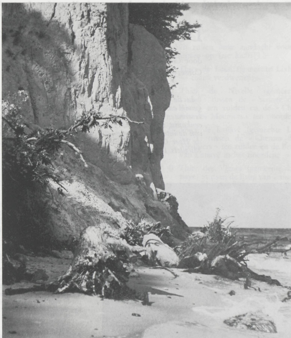
Klippen in het natuurreservaat van Ortowo.

woud van Bialowieza, het nationaal park van Wolin langs de zee, dat van Kampinos bij Warschau en van Ojcow bij Krakau, en de talrijke reservaten (meer dan 600). Straks zullen ze ook kunnen vermelden dat Polen een paradijs is voor de steeds talrijker wordende natuurliefhebbers, een land waar de jongeren belangstelling voor de ecologie opbrengen. Begunstigd met alle weldaden van de moderne beschaving,