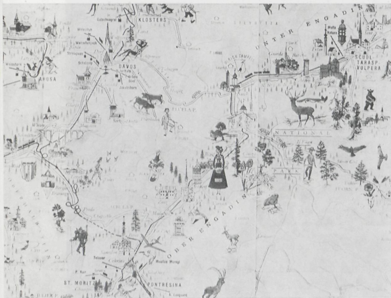
Ligging van het Zwitsers Nationaal Park.

De Liga is aansprakelijk voor de bewaking en de Zwitserse Vereniging voor Natuurwetenschappen leidt het wetenschappelijk onderzoek; de Confederatie betaalt de schadevergoedingen. Deze overeenkomst werd op 1 augustus 1914 door de Federale Kamers bekrachtigd. Van die dag af werd het natuurreservaat, opgericht dank zij het privé-initiatief van enkele natuurliefhebbers, ZWITSERS NATIONAAL PARK genoemd.