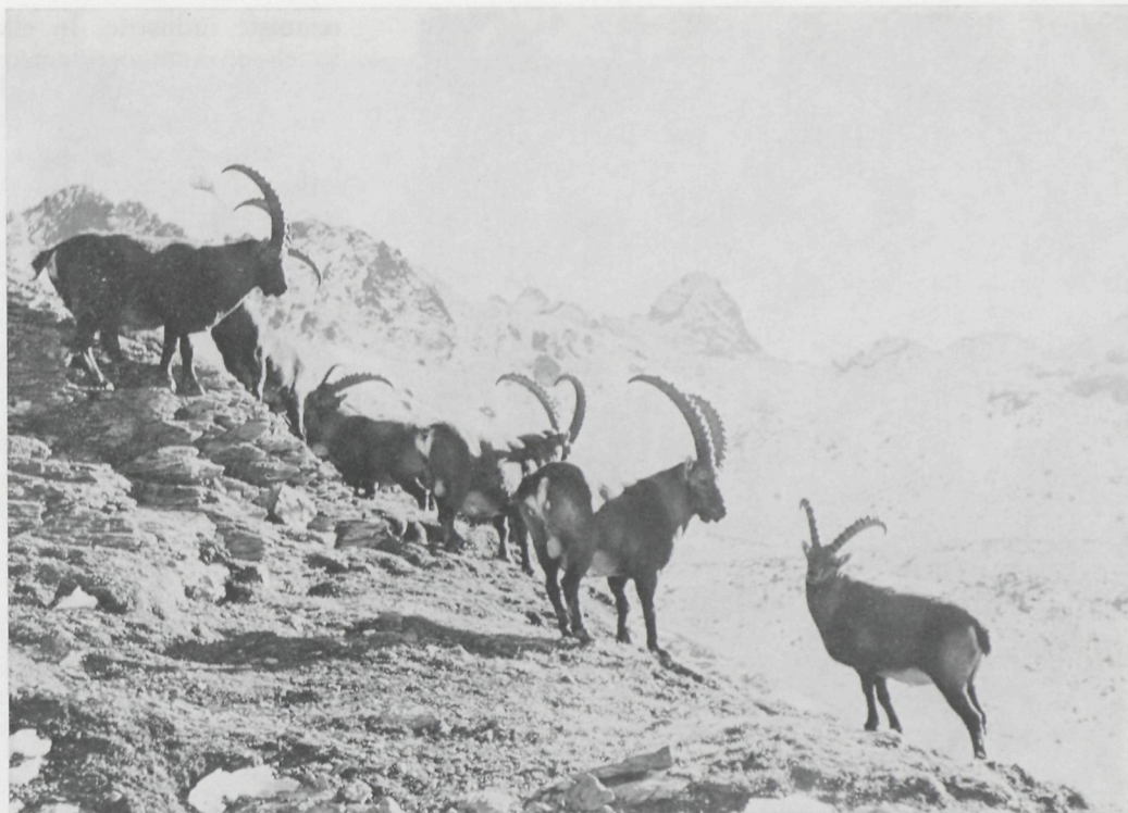
De Trupchunvallei. Op de achtergrond de Piz d'Esan.

De steenbokken ( Capra hircus ) trekken zich terug op de hoogst gelegen plaatsen, niet ver van de eeuwige sneeuw.