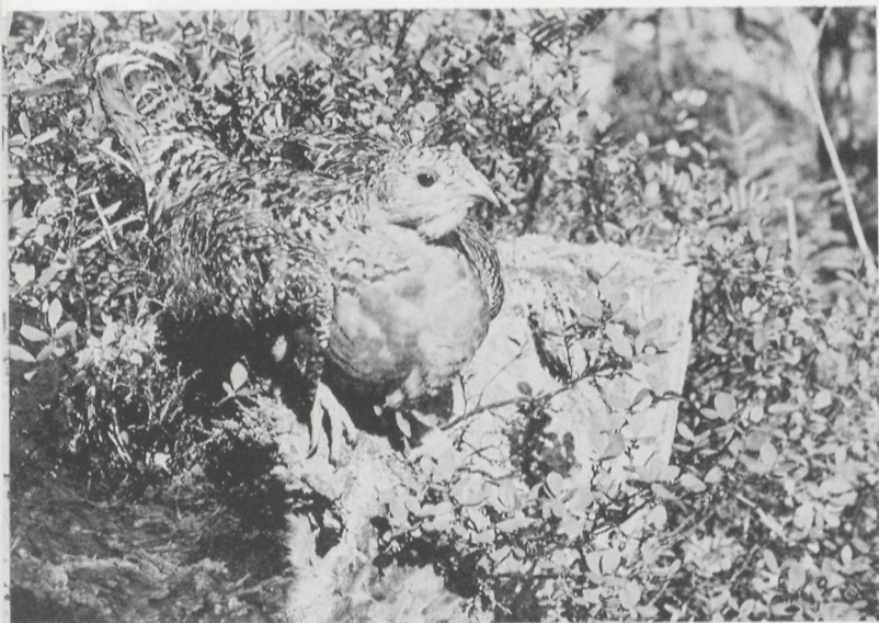
Het wijfje van het auerhoen ( Tetrao urogallus ).