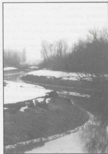
De Durme nabij "Ten Rijen" te Waasmunster.

Niet alleen de oppervlakte schorre vermindert, ook de natuurhistorische kwaliteit gaat achteruit. Door de steeds verdergaande waterbezoedeling van de Durme, waarvan het water twee maal daags deze gebieden overspoelt, is de flora vrijwel beperkt tot enkele soorten die bestand zijn tegen deze dynamiek (Groot-Hoefblad, Riet, Dotterbloem, Zeeaster, Wilgeroosje, Perzikkruid). Momenteel kan men de schorren in drie categorieën indelen: de zuivere rietschorren met botanisch en ornithologisch hoge waarde, de rietwilgenschorren en de totaal met wilg overgroeide gebieden die voornamelijk ornithologische waarde bezitten. Het grootste deel behoort tot de laatste twee categorieën.